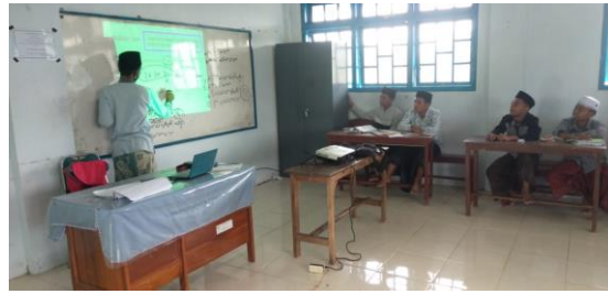
Gambar 4.6. Proses KBM di Kelas Sains Al-Qur'an