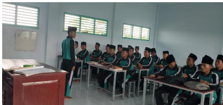
Gambar 4.2. Siswa Kelas X Taruna