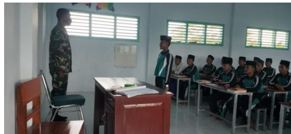
Gambar 4.8. Proses KBM di Kelas Taruna

Selain itu juga yang perlu diperhatikan dalam pengembangan madrasah yang dilakukan melalui program kelas unggulan yaitu mengenai sarana prasarana yang dibutuhkan sebagai penunjang keberhasilan kelas unggulan yang sudah direncanakan, sarana tersebut meliputi sarana yang dibutuhkan saat kegiatan belajar mengajar, ruang kelas yang representatif, ruang perpustakaan dan juga ruang laboratorium yang memadai dan juga sarana prasarana penunjang lainnya. Sebagaimana penuturan Ustadz Muzammil Imron sebagai berikut: