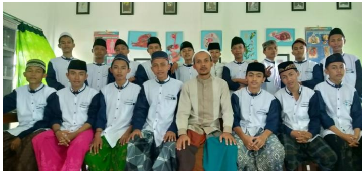
Gambar 4.1. Siswa Kelas X Sains Al-Qur'an

Hal tersebut dapat dilihat dari hasil dokumentasi berikut: