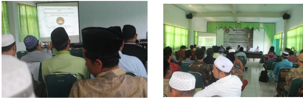
Gambar 4.11. Rapat Evaluasi yang dilaksanakan tiap Tahun yang dikemas dengan acara halal bihalal dan serap aspirasi