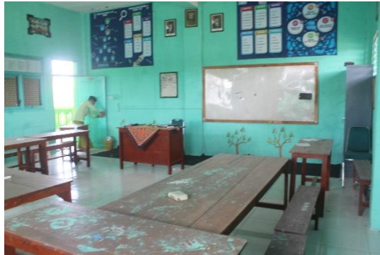
Gambar 4.9. Ruang Kelas Unggulan

Hal tersebut diperkuat dengan hasil observasi dan dokumentasi yang peneliti peroleh di lapangan, bahwa sarana prasarana yang ada di kelas unggulan sangat memadai, meliputi ruang kelas yang representatif, dan juga sarana penunjang lainnya meliputi ruang perpustakaan, laboratorium dan lainnya. 31