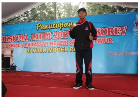
Gambar 4.13. Salah Satu Siswa Kelas Unggulan yang berprestasi di tingkat Nasional

Dari beberapa pernyataan tersebut dapat disimpulkan dengan adanya kelas unggulan sangat berdampak sekali terhadap perkembangan madrasah, baik dari segi prestasi, maupun dari lulusannya yang mau melanjutkan studinya ke jenjang S-1 banyak yang diterima di kampus-kampus ternama di dalam maupun di luar negeri.