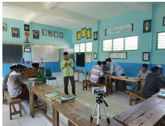
Gambar 4.7. Proses KBM di Kelas Bilingual