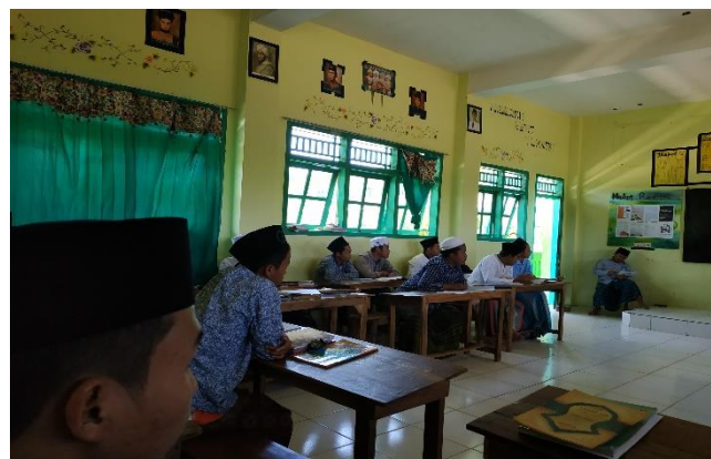
Gambar 4.3. Siswa Kelas X Bilingual