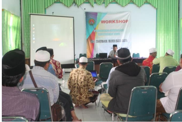
Gambar 4.4. DIKLAT Peningkatan Kompetensi Kepribadian Guru

Berikut beberapa dokumentasi yang peneliti berhasil dapat di lapangan mengenai diklat ataupun pelatihan-pelatihan yang diadakan oleh Madrasah Aliyah Mambaul Ulum Bata-Bata Palengaan Pamekasan: