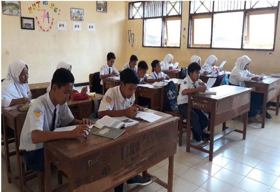
Foto pada saat pengisian angket