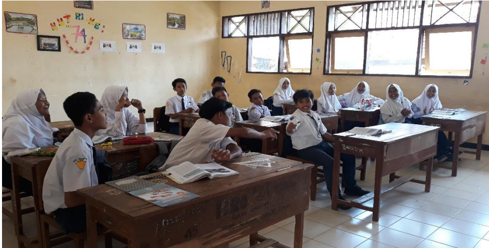
Foto saat proses pembelajaran menggunakan talking stick