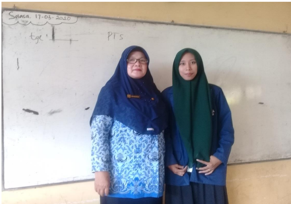
Foto bersama guru mata pelajaran IPS