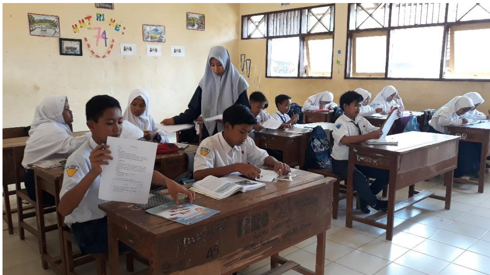
Foto pada saat penyebaran angket