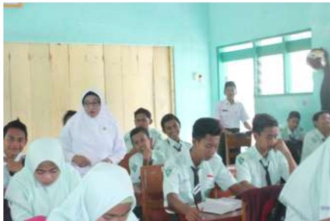
Proses pembelajaran di dalam kelas