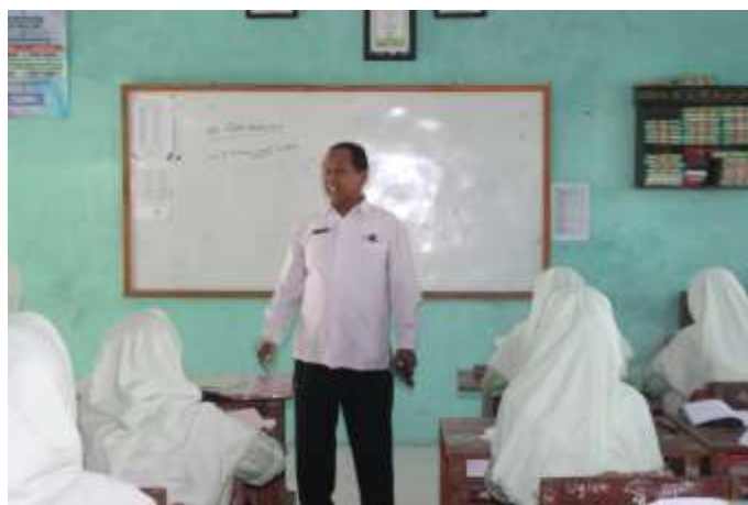
Guru memberikan motivasi kepada siswa agar giat belajar