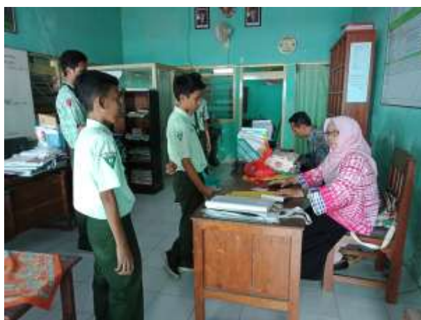
Guru BK sedang memanggil siswa yang bolos masuk kelas