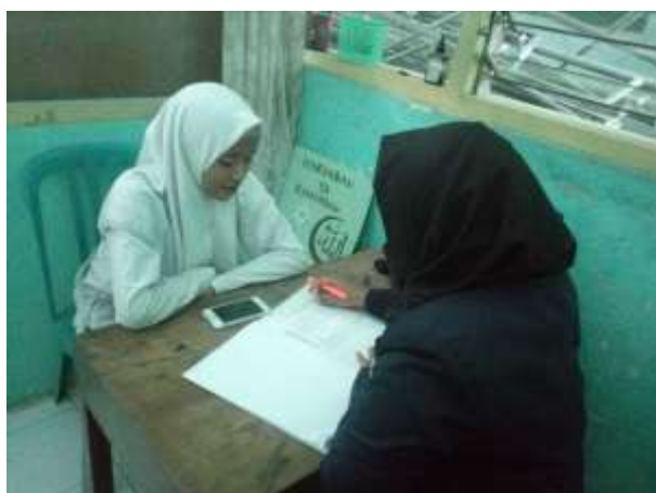
Wawancara dengan salah satu siswi di Ruang BK