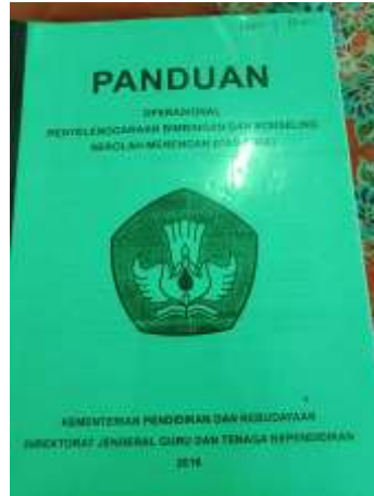
Pedoman penyelenggaraan BK di MAN 1 Pamekasan