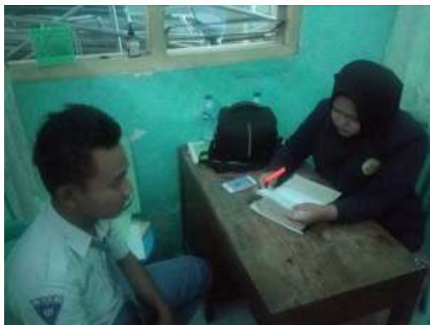
Wawancara dengan salah satu siswa di Ruang BK