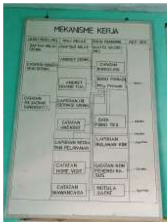
Papan Mekanisme kerja di Ruang BK