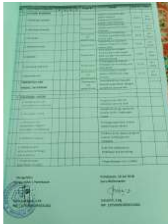
Program Bimbingan dan Konseling Sekolah