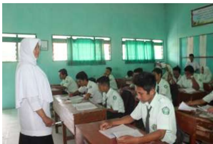
Guru sedang memberikan arahan kepada siswa