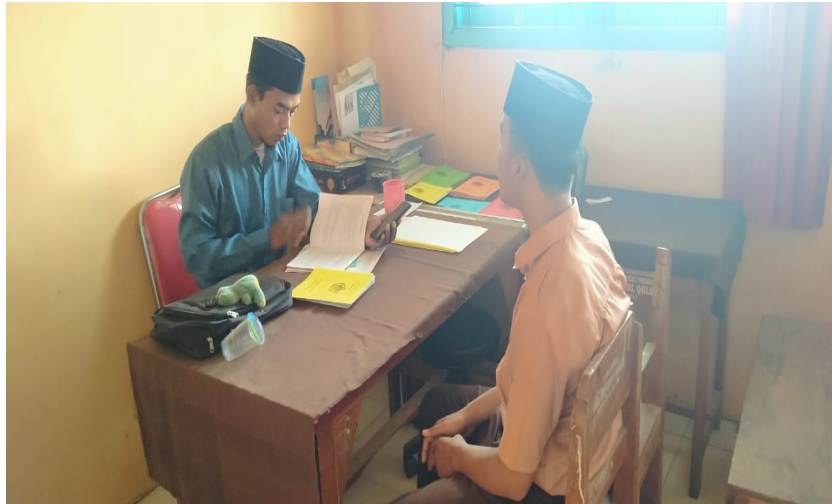
Siswa merencanakan karirnya kepada guru BK