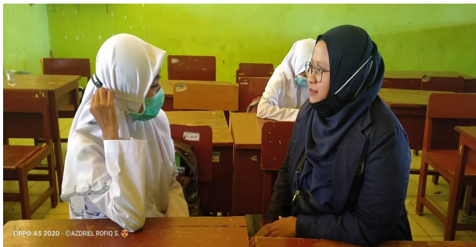
Wawancara dengan Siswa Kelas X di Ruang Kelas SMAN 5 Pamekasan