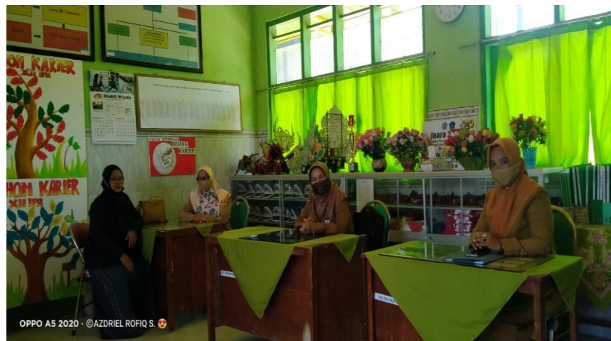
Foto Bersama saat Wawancara Langsung dengan Guru BK SMAN 5 Pamekasan