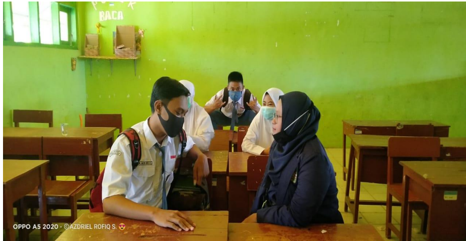
Wawancara dengan Siswa Kelas XI di Ruang Kelas SMAN 5 Pamekasan