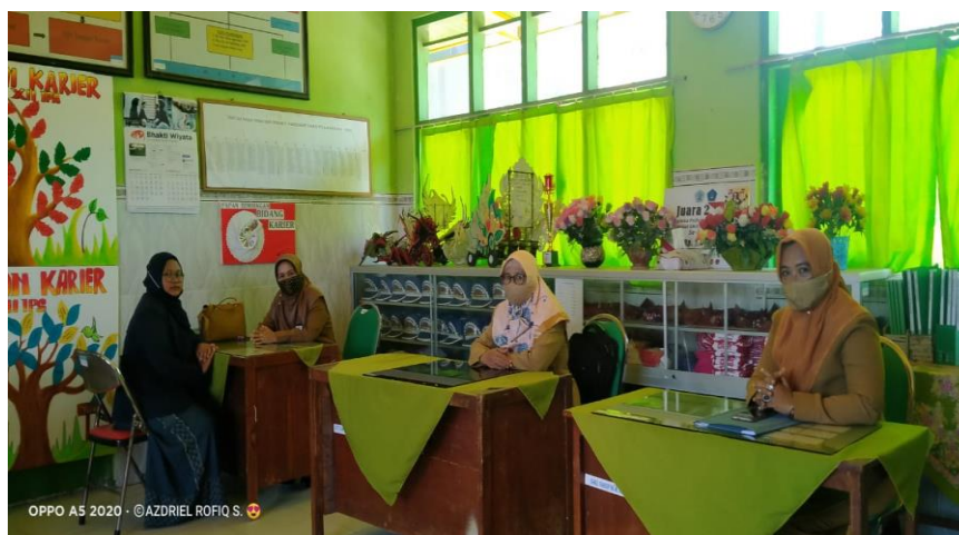
Wawancara dengan Guru BK di Ruang BK SMAN 5 Pamekasan