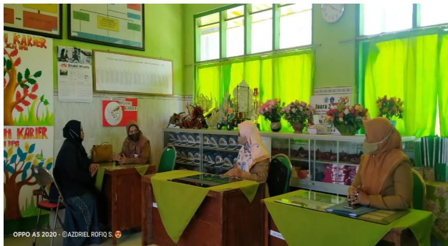
Wawancara dengan Guru BK di Ruang BK SMAN 5 Pamekasan