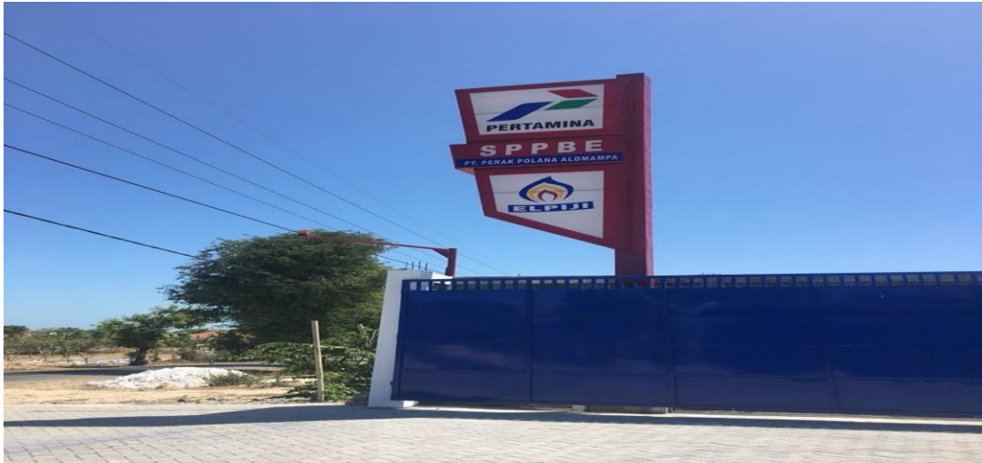
Gambar 1.1. PT Perak Polana Alomampa dari depan