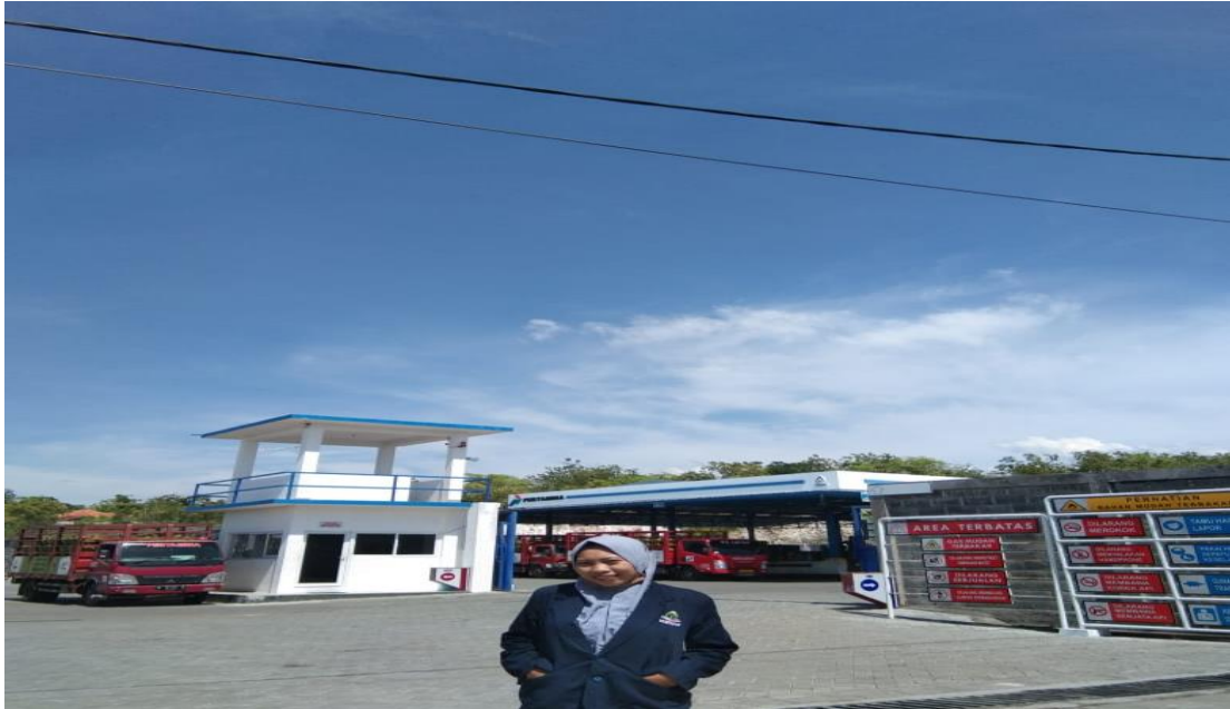
Gambar 1.4. Peneliti obsevasi keadaan di PT Perak Polana Alomampa