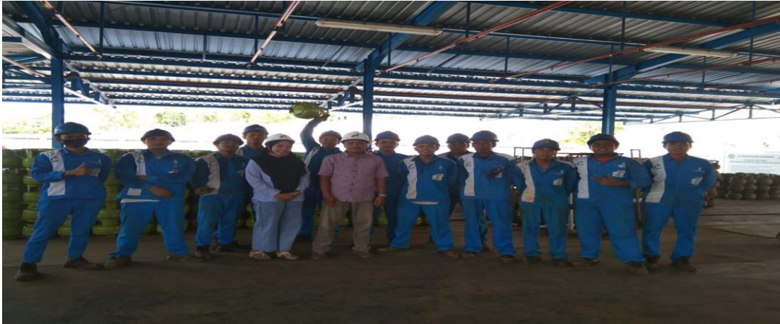
Gambar 1.3. Peneliti dengan para karyawan PT Perak Polana Alomampa