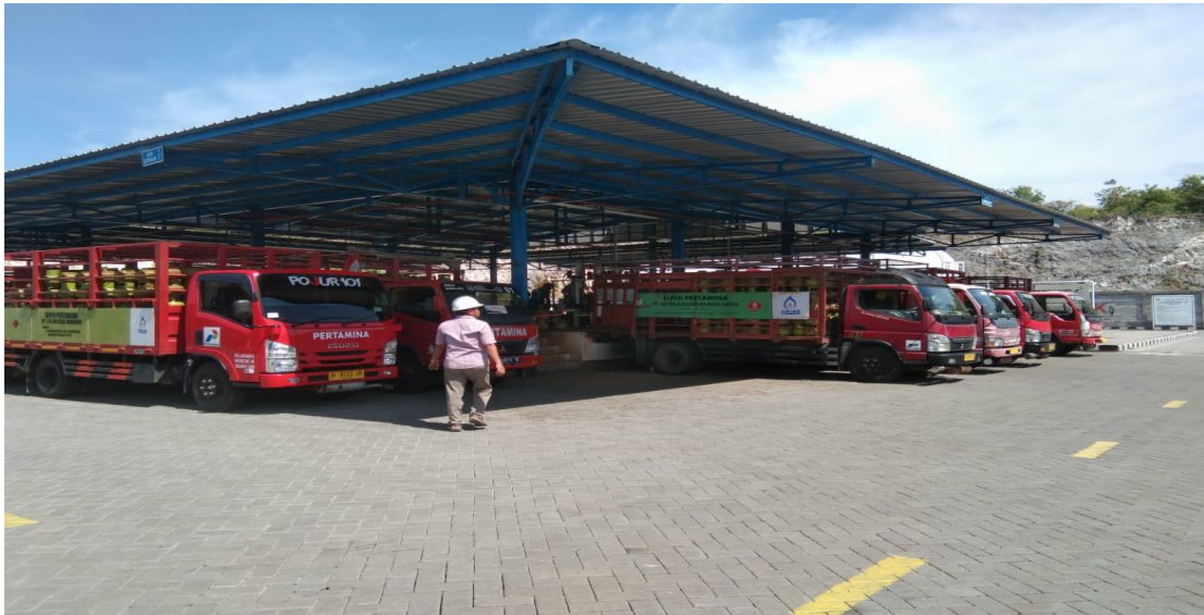
Gambar 1.5. Agen yang bekerjasama dengan PT Perak Polana Alomampa