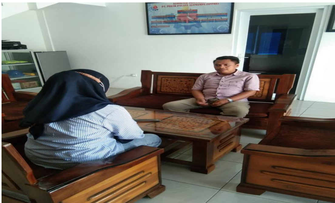
Gambar 1.6. Peneliti wawancara dengan HRD PT Perak Polana Alomampa