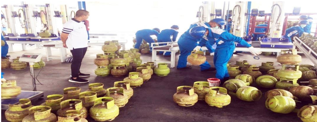
Gambar 1.2. direktur PT Perak Polana Alompa mengawasi karyawan yang melakukan pengisian Elpiji