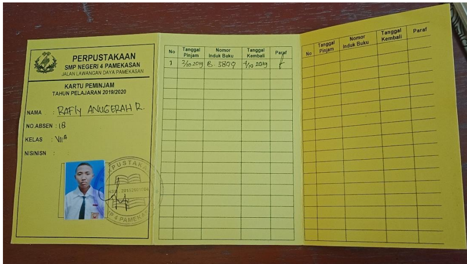
(Dokumentasi Kartu pengunjung)