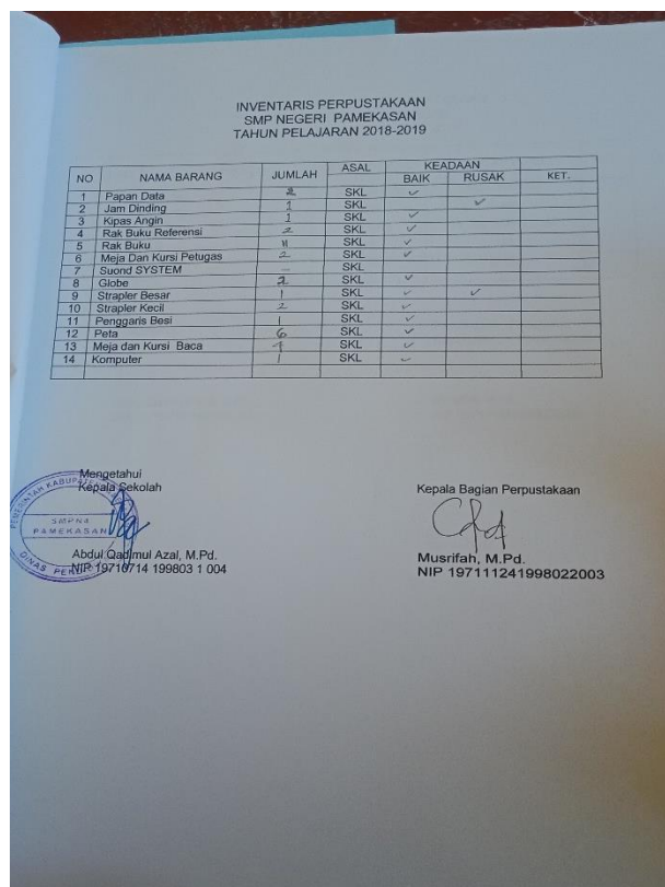
(Dokumentasi buku inventaris perpustakaan)