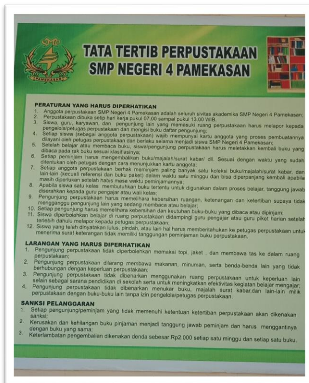
(Dokumentasi Tata Tertib Perpustakaan)