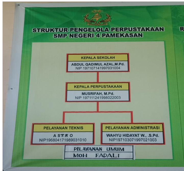
(Dokumentasi struktur pengelolaan perpustakaan)