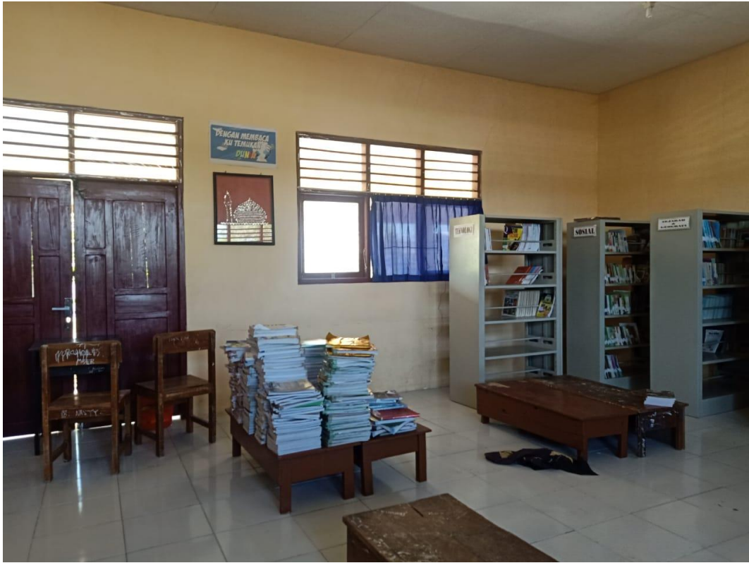
(Dokumentasi kondisi perpustakaan)