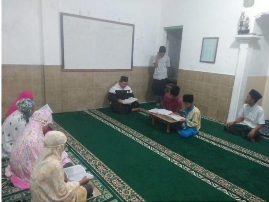
Peserta didik saat diberi hukuman