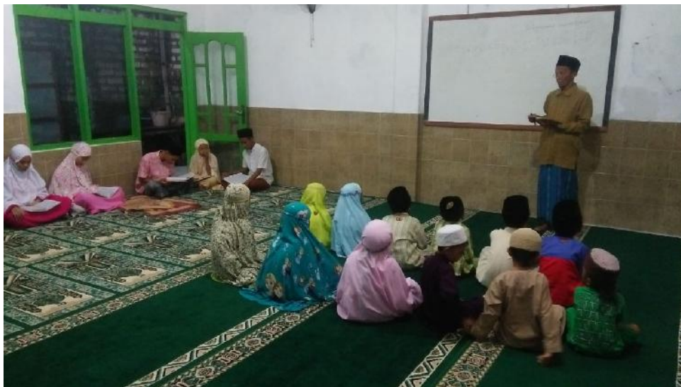
Pengantar sedang mengajarkan akhlaqul karimah yang bersumber dari buku keagamaan islam