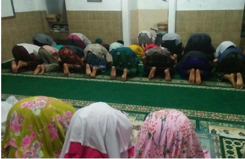
Peserta didik saatsedang melaksanakh sholat berjamaah dengan masyarakat