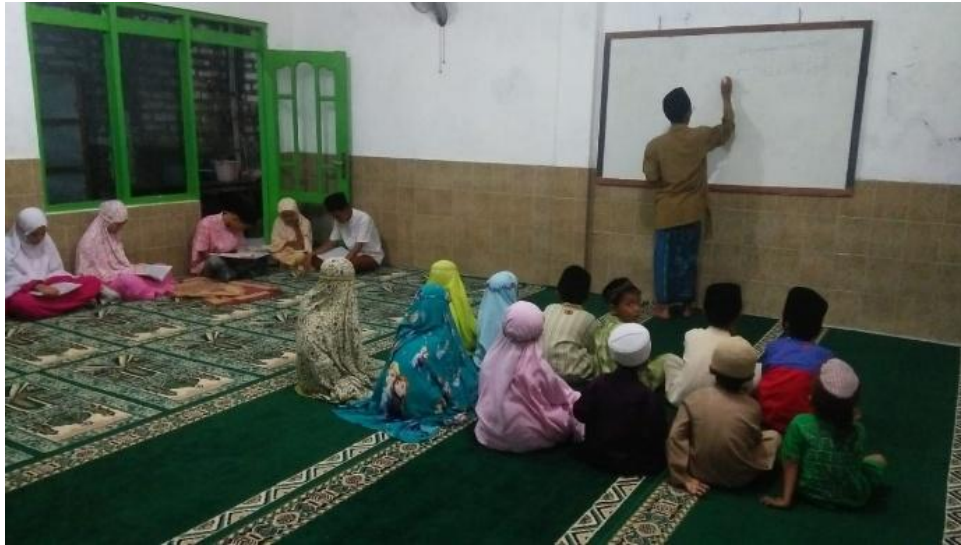
Pengajar sedang memberikan ajaran akhlaqul karimah pada peserta didik