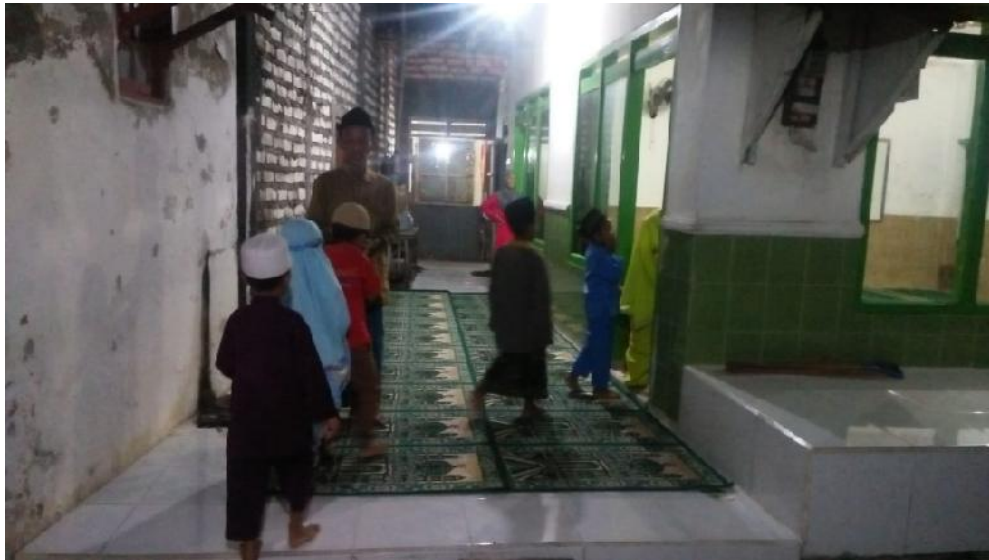
Peserta didik saat melakukan budaya salam