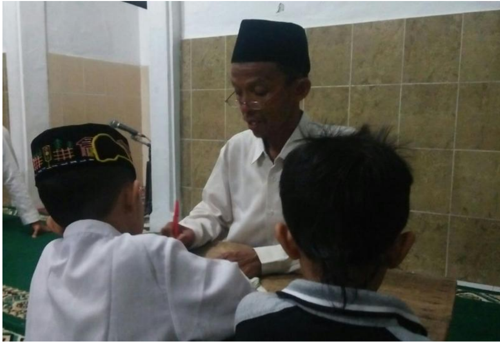
Kegiatan dalam belajar mengaji