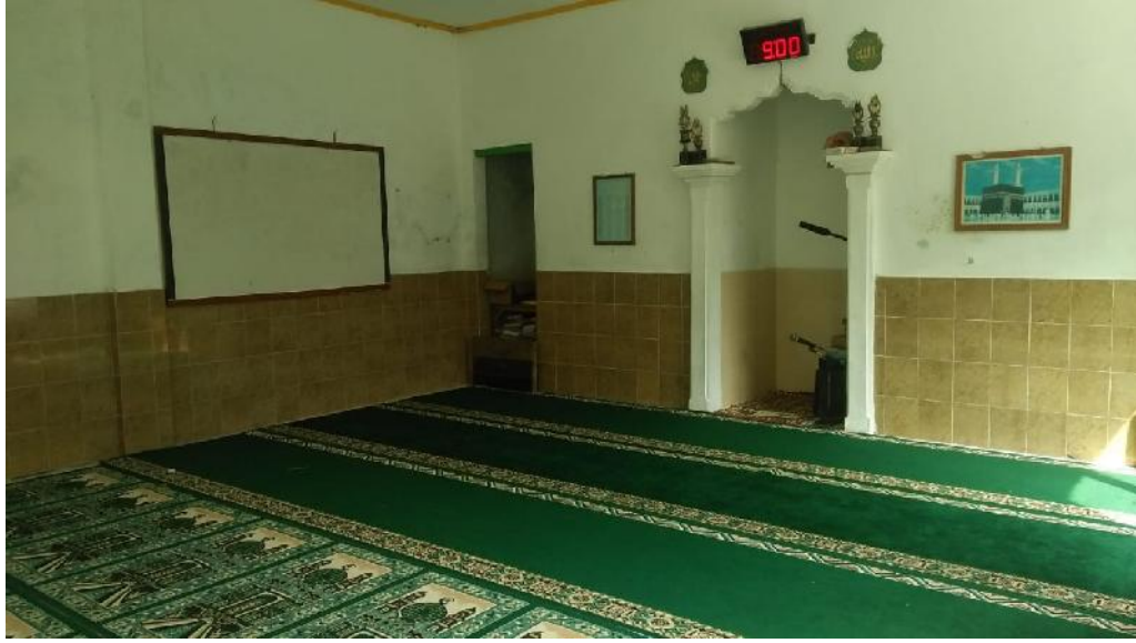
Musholla Bustanul ulum