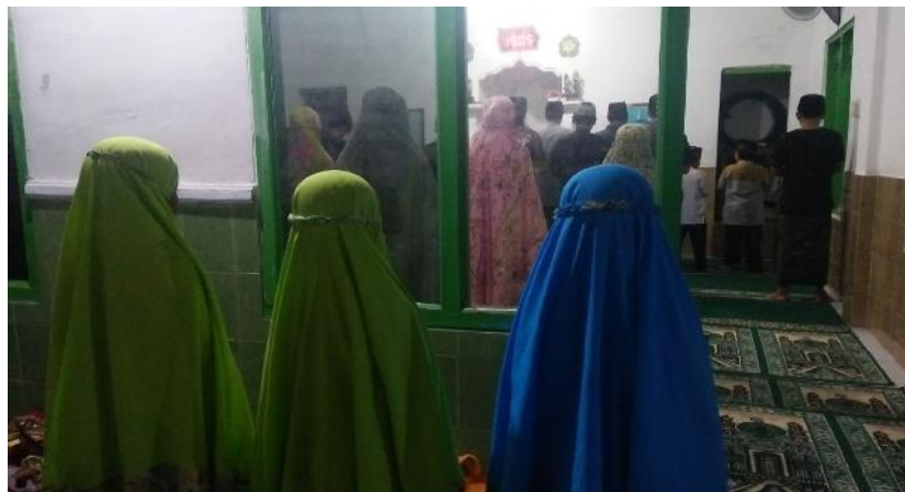
Kegiatan sholat berjema'ah