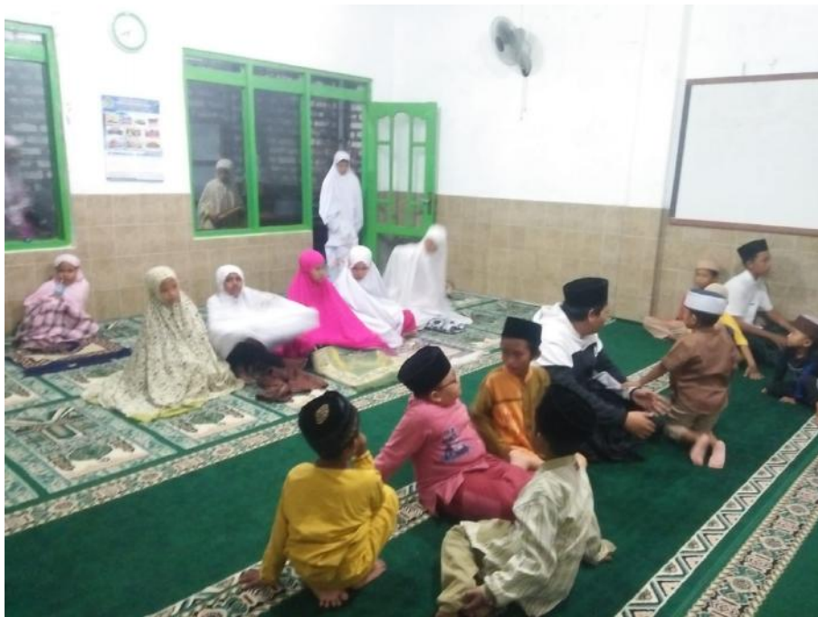
Ustadzah saat datang telat dan lupa mengucapkan salam