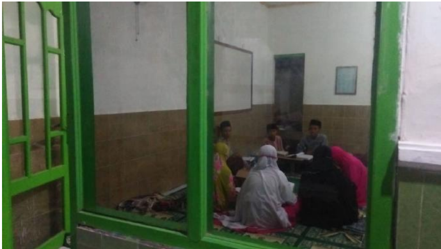
Proses belajar mengajar membaca Al-qur'an