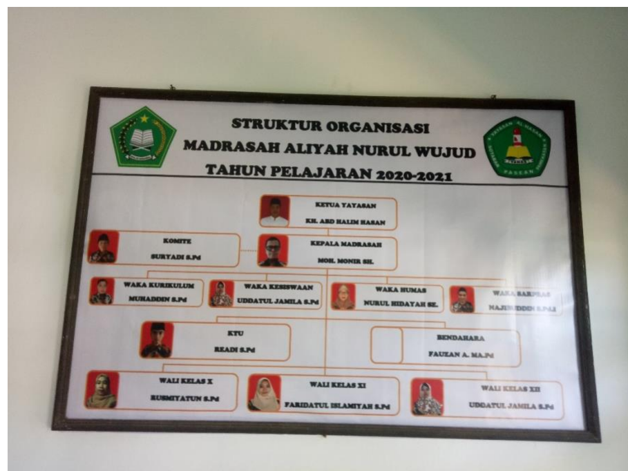
Struktur guru dan karyawan Madrasah Aliyah Nurul Wujud Sotabar Pamekasan.