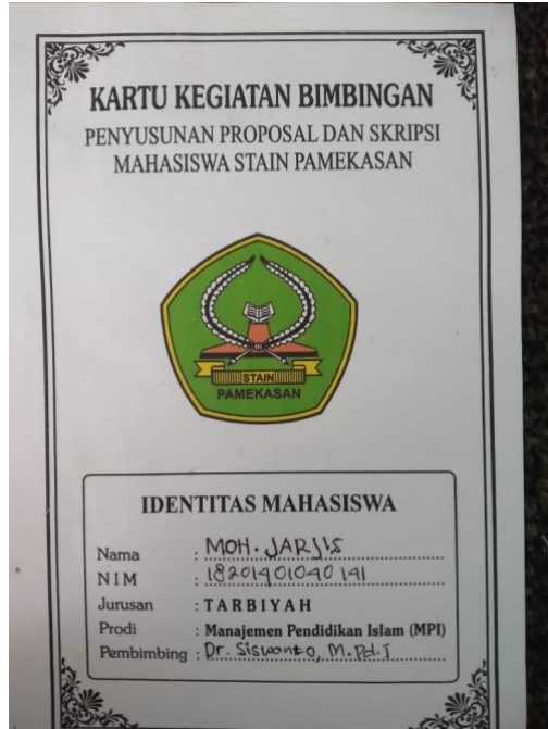
A. Blangko Isian Untuk Bimbingan Penyusunan Proposal