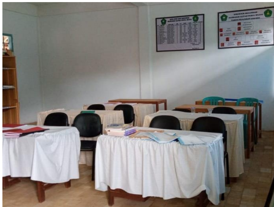
Ruang guru di Madrasah Aliyah Nurul Wujud Sotabar Pasean Pamekasan