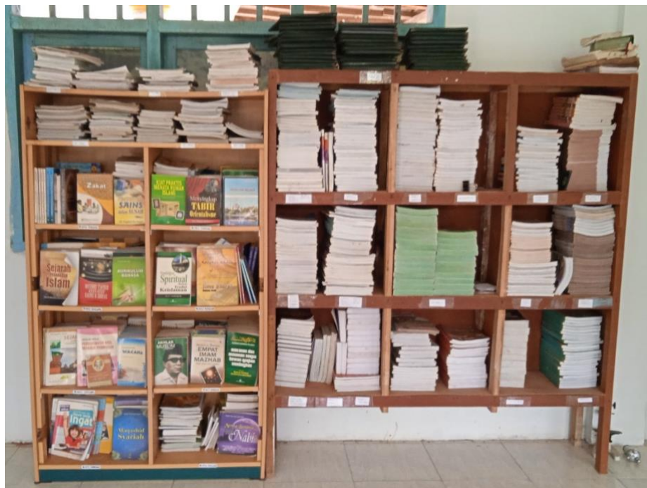
Perpustakaan di Madrasah Aliyah Nurul Wujud Sotabar Pasean Pamekasan