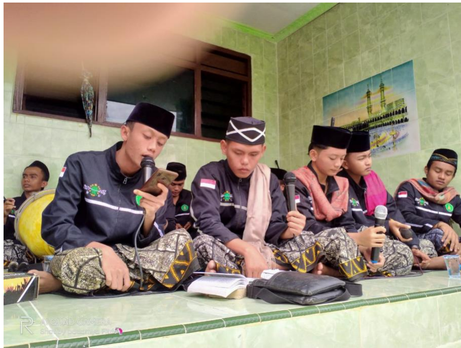
Kegiatan Al-Banjari di Madrasah Aliyah Nurul Wujud Sotabar Pasean Pamekasan