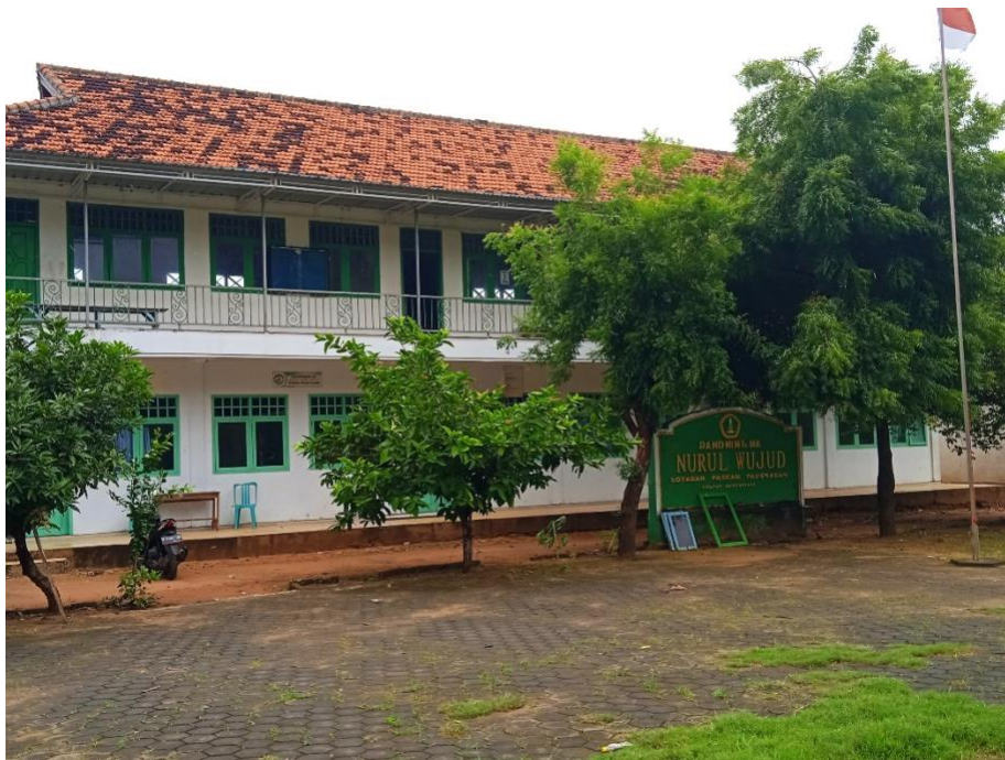
Profil Madrasah Aliyah Nurul Wujud Sotabar Pasean Pamekasan