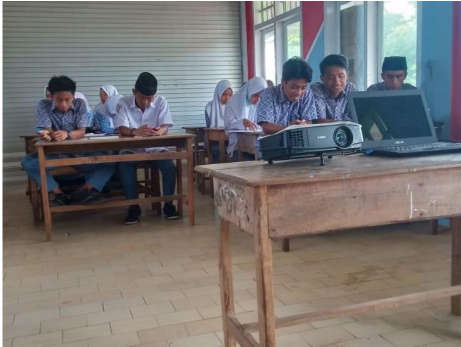
Proses kegiatan belajar mengajar di MAS Nurul Wujud Pasean