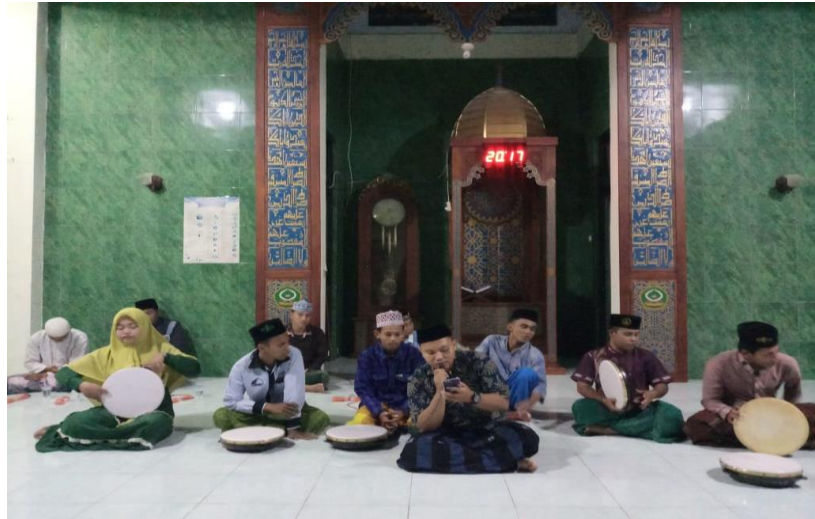
Gambar 4.1 Latihan Pembekalan Untuk Siap Terjun ke Masyarakat

Adapun mengenai kegiatan-kegiatan seperti rutinitas yang ada di UKM