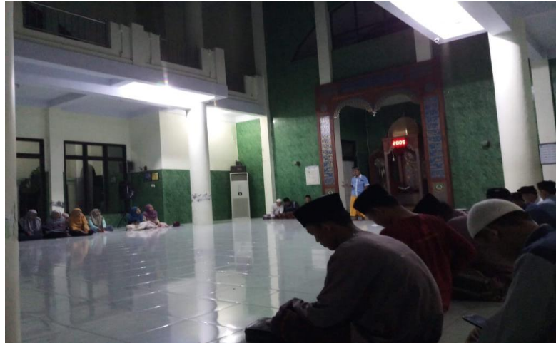
Gambar 4.2 Kegiatan Rutinitas yang diadakan Setiap Malam Jum'at

Hal yang sama juga dinyatakan oleh saudari Ainun Yatin: