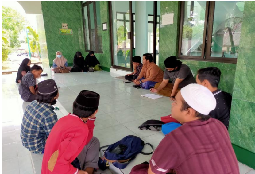
Gambar 4.6 Kurangnya Motivasi Diri dari Setiap Anggota Sehingga Setiap diadakannya Kegiatan Tidak Selalu Tepat Waktu

juga ada 2 yaitu dari segi internal dan eksternal, dimana dari segi eksternal yaitu ketika ada kebijakan dari kalangan atas seumpama kita mengambil contoh di era pandemi kita harus menonaktifkan segala sesuatu di kampus, jadi itu merupakan salah satu faktor internal kebijakan kampus mengeluarkan untuk menonaktifkan segala kegiatan, selanjutnya faktor penghambat dari segi internal yaitu kurangnya motivasi dari setiap anggota iqda, mengapa begitu kak karena sudah biasa anak organisasi kalau ada latihan teman-teman itu banyak yang menunda-nunda waktu (jam karet).” 64