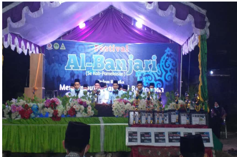
Gambar 4.5 Acara Lomba Festival Al-Banjari di Tanjung, Pademawu, Pamekasan

“Pada hari Sabtu tanggal 03 April 2021 saya menghadiri lomba festival banjari yang diikuti oleh UKM Iqda di daerah Tanjung, Pademawu, Pamekasan. Saya mengamati dari anggota iqda ini sangat memimpin dalam mengikuti lomba tersebut, meskipun dalam festival tersebut mereka tidak juara tapi mereka sangat bangga karena memiliki pengalaman yang nantinya berguna jika sewaktu-waktu mereka terjun ke masyarakat.” 62