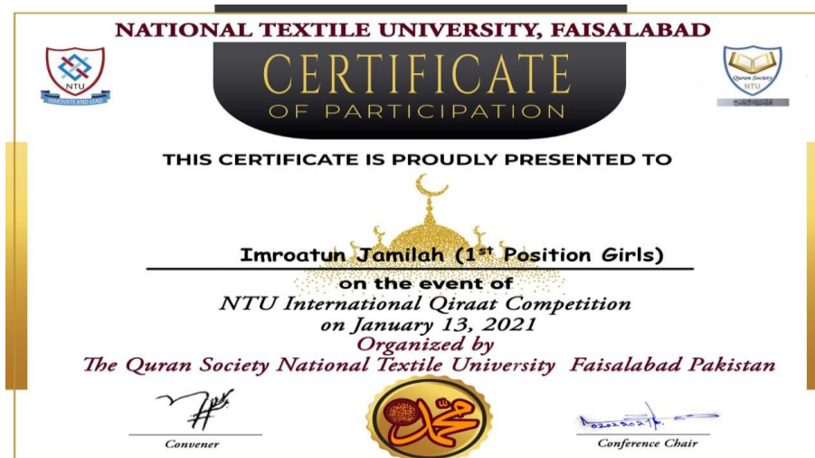
Gambar 4.7 Bukti Sertifikat Penghargaan Bagi Anggota UKM Iqda IAIN Madura

karena tidak ada pelatih thilawatil Qur'an yang didatangkan, tidak adanya pelatih karena faktor keterbatasan biaya, terkadang saya memberikan bantuan pribadi kepada iqda untuk anggaran laboratul ibadah dimana saya mengusahakan dan mensupport kegiatan di masjid, Penghambat yang kedua yaitu di bidang Da'i dimana pembina khusus untuk da'i tidak ada dan sepengetahuan saya mereka melakukan kegiatan itu tapi saya tidak tahu, sebagai pendukung dari kegiatan ini anggota iqda banyak yang dilibatkan dalam kegiatan mewakili IAIN Madura dalam kegiatan regional maupun nasional seperti reonir itu, ada anggota iqda yang mewakili dalam thilawatil Qur'an yaitu "Imroatul Jamilah" dari sampang dan mendapatkan juara nasional pada tahun 2001 di thilawatil Qur'an virtual di internasional dan anak tersebut bergabung di iqda program imtak, penghambat yang ketiga yaitu keterbatasan fasilitas sarana dan prasarana dalam pengembangan minat dan bakat tenaga pembina bantuan yang dibiayai oleh Warek III sangat terbatas begitupun dengan anggaran ormawa juga sangat terbatas.” 65