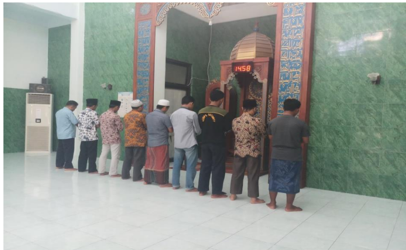
Gambar 4.4 Memakmurkan Masjid dengan diadakannya Sholat Berjemaah

“Kalau secara umum peran kegiatan di UKM Iqda ini ada himbauan kepada mahasiswa khususnya anggota Iqda untuk memakmurkan masjid untuk sholat berjemaah diwaktu sholat duhur dan ashar, hal ini merupakan himbauan dari pihak kampus yang religious, dan saya yang juga menjadi ketua takmir menghimbau kepada semua ormawa untuk selalu melakukan sholat berjemaah di masjid pada waktu duhur dan ashar. Sedangkan untuk maghrib, isya’, dan subuh itu merupakan tanggung jawab anggota iqda untuk menjadi imam sholat di masjid. Sehingga mereka dapat membangun sendiri kereligiusan mereka dan juga kampus. Di samping itu semua untuk meningkatkan budaya religius, dan kekompakitan di IAIN Madura yaitu untuk membina kepada jalan religious maka mereka diberikan tanggung jawab untuk menjadi imam shalat pada waktu maghrib, isya’, dan subuh.” 61