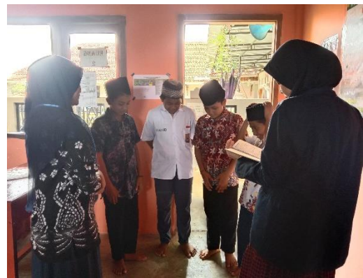
Pembagian naskah drama