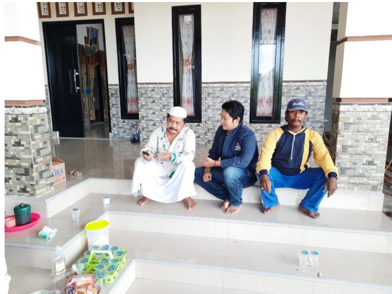
FOTO DOKUMENTASI PENELITIAN DI UD. SOLTOK DESA PADELEGAN KECAMATAN PADEMAWU KABUPATEN PAMEKASAN