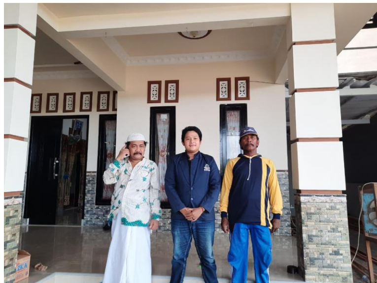
Wawancara dengan pemilik UD. Soltok dan salah satu karyawan UD. Soltok