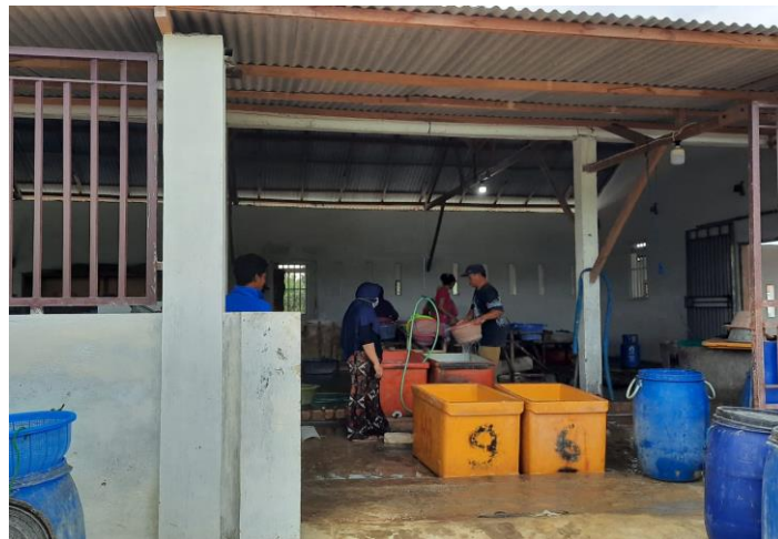
Penimbangan ikan teri sebelum diolah