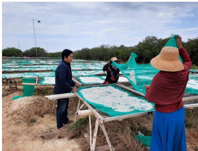
Pemilahan antara ikan teri yang layak di pasaran dan yang tidak layak untuk dipasarkan