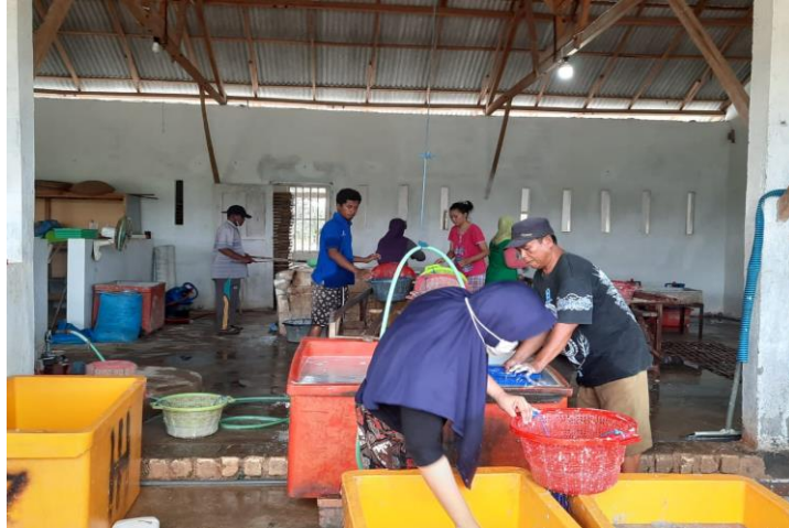
Proses pengolahan ikan teri