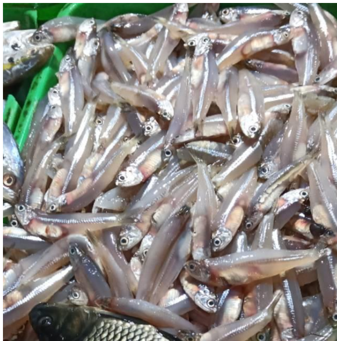
Ikan teri basah