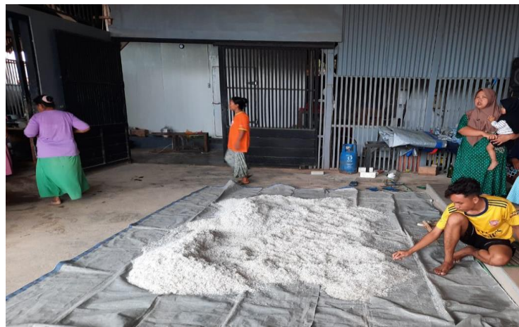
Ikan teri yang belum diolah