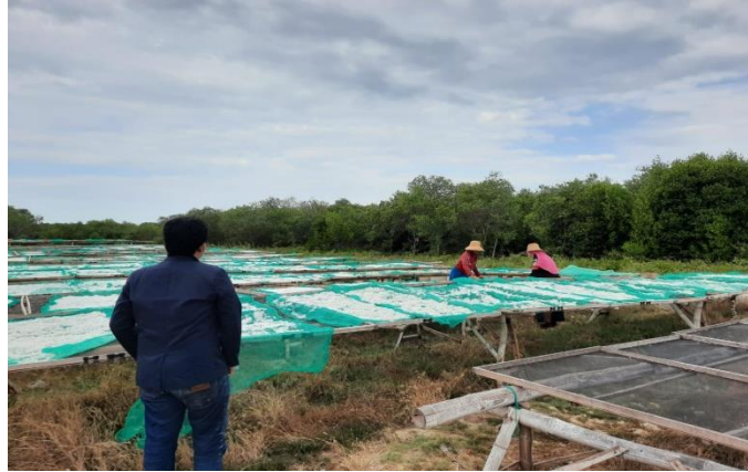
Proses penjemuran ikan teri yang sudah diolah