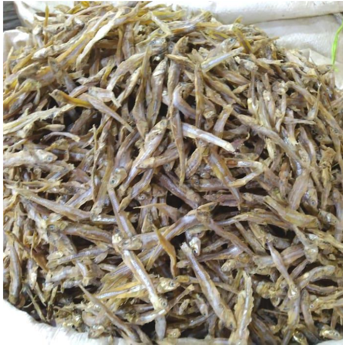
Ikan teri kering