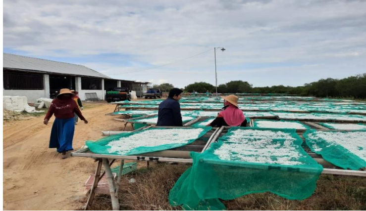
Wawancara dengan karyawan UD. Soltok