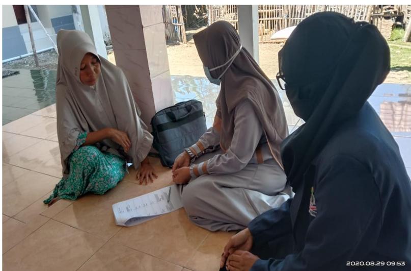
gambar 5 melakukan home visit/ kunjungan kerumah siswa.