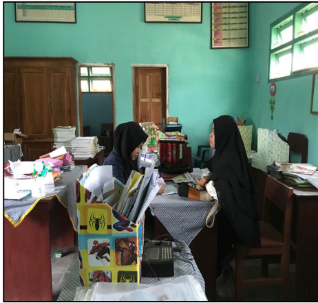
FOTO KEGIATAN WAWANCARA