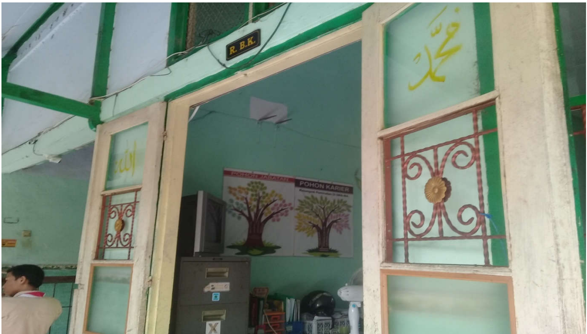
Ruang BK Di lihat Dari Depan