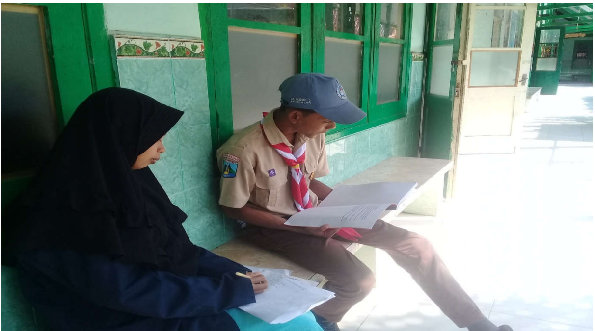
Wawancara Dengan Kelas XI Khairul Anam