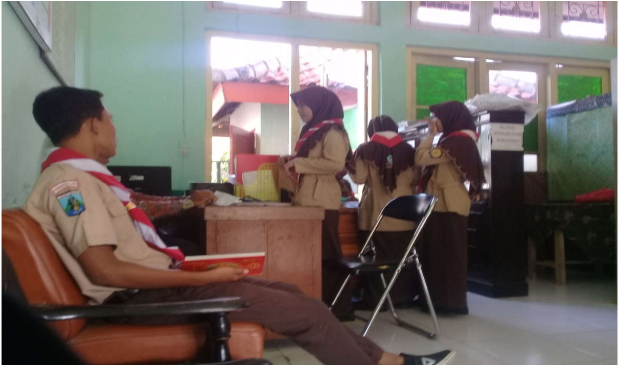
Siswa Datang Terlambat Masuk Madrasah Di beri Sangsi