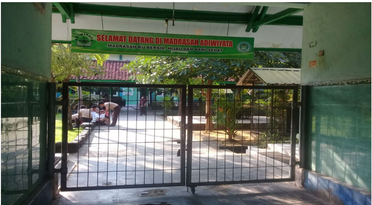
Pintu masuk MAN 2 Pamekasan