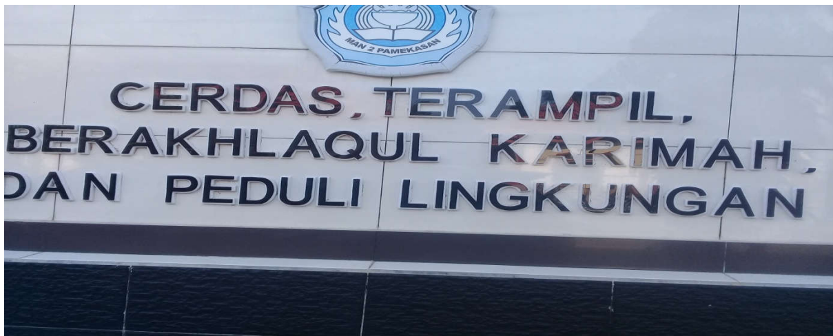
Visi Madrasah Aliyah Negeri 2 Pamekasan.