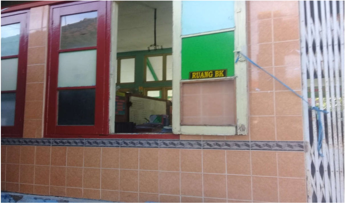
Ruang BK Di Lihat Dari Belakang