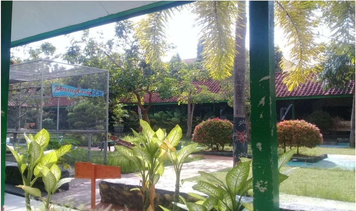
Halaman Taman MAN 2 Pamekasan