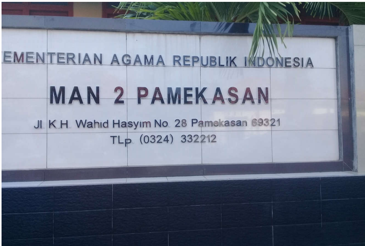
Halaman Depan Madrasah Aliyah Negeri 2 Pamekasan.