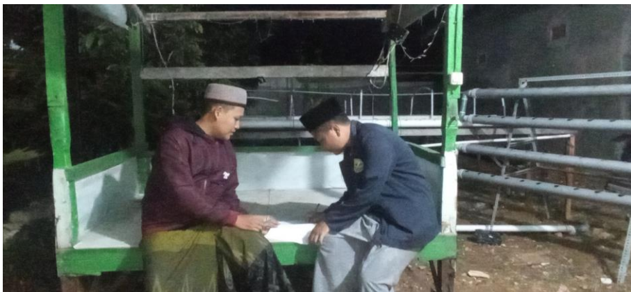
Lampiran 10 dokumentasi bersama warga