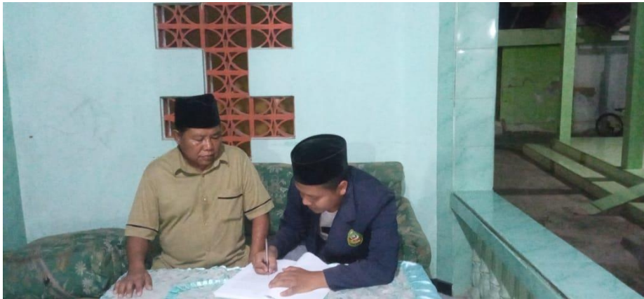
Lampiran 9 dokumentasi bersama warga