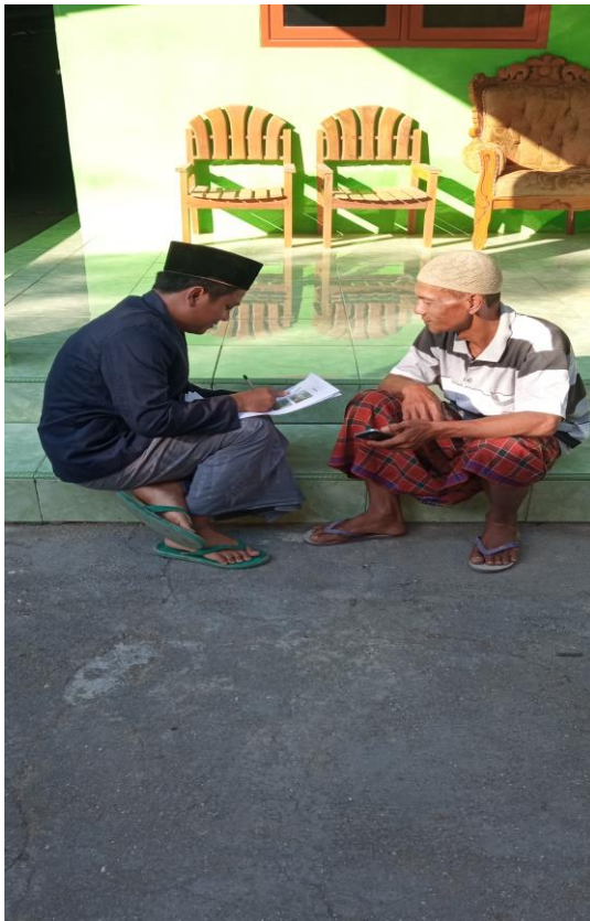
Lampiran 12 dokumentasi bersama warga