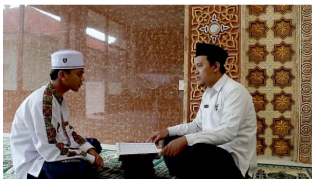
Gambar 4.5: Kegiatan Ekstrakurikuler Tahfidz di MAN 1 Pamekasan 21