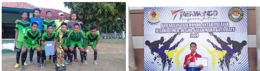
Gambar 4.9: foto kejuaraan ekstrakurikuler di MAN 1 Pamekasan. 36