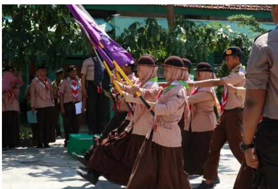
Gambar 4.4: Kegiatan Ekstrakurikuler Pramuka di MAN 1 Pamekasan 20

Selain itu, untuk lebih memperkuat hasil dari wawancara tersebut, maka diperkuat dengan adanya dokumentasi terkait kegiatan ekstrakurikuler di Madrasah Aliyah Negeri 1 Pamekasan. Berikut beberapa contoh kegiatan ekstrakurikuler MAN 1 Pamekasan: