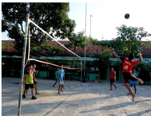
Gambar 4.7: Kegiatan Ekstrakurikuler Volly di MAN 1 Pamekasan. 23

Berdasarkan paparan di atas, data pokok yang peneliti peroleh di lapangan dapat dipahami bahwa minat dan bakat peserta didik dapat dikembangkan melalui berbagai macam kegiatan ekstrakurikuler seperti pramuka, tahfidz, bola voli, dan PMR atau yang lainnya. Hal ini bertujuan untuk mengembangkan potensi-potensi dan bakat serta keahlian mereka masing-masing baik dibidang keagamaan, kesenian, olahraga maupun lainnya.