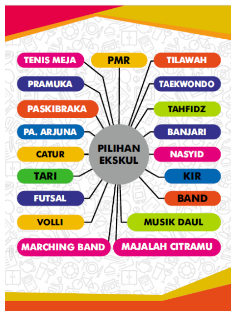
Gambar 4.2: Brosur macam-macam ekstrakurikuler di MAN 1 Pamekasan. 10

Untuk lebih memperkuat hasil dari wawancara tersebut, maka diperkuat dengan adanya brosur macam-macam layanan ekstrakurikuler di di Madrasah Aliyah Negeri 1 Pamekasan .