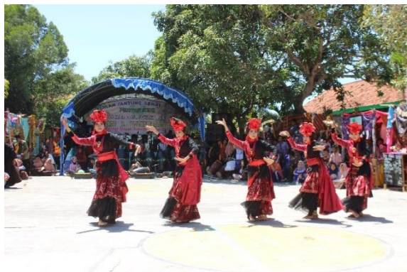
Gambar 4.6: Kegiatan Ekstrakurikuler Tari di MAN 1 Pamekasan 22