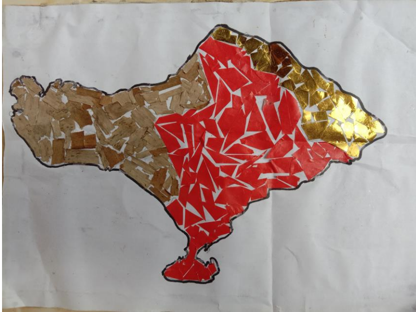
(contoh Media Kolase)