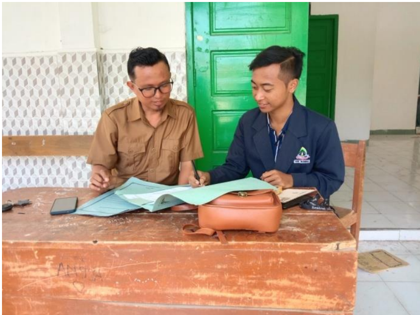
(Wawancara dengan Kepala Sekolah MTs Sabilul Muttaqien)