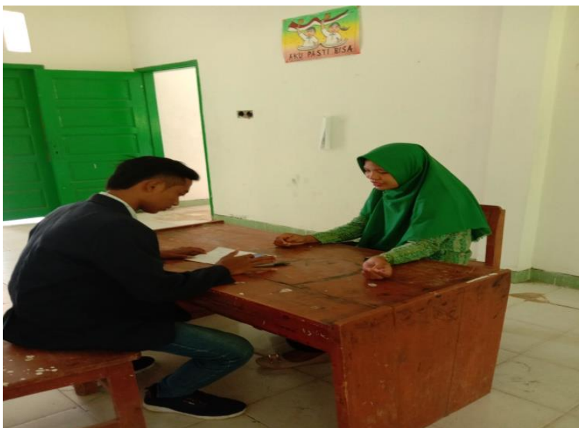
(Wawancara dengan Guru Mapel IPS MTs Sabilul Muttaqien)