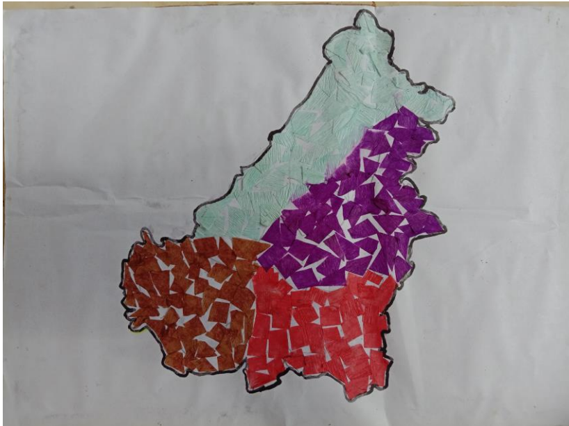
(contoh Media Kolase)