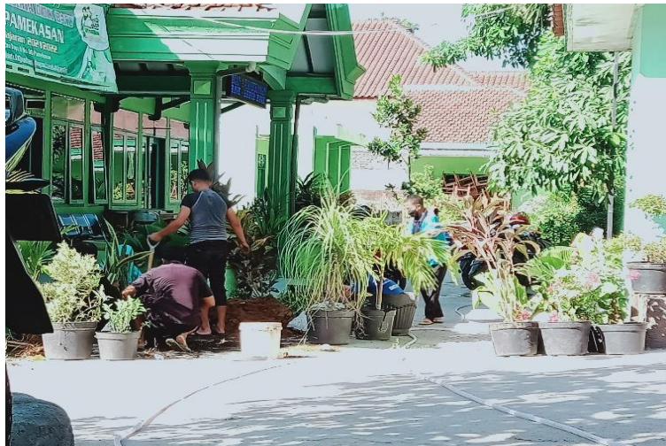
Gambar 4.3 Perawatan tumbuhan. 48

Gambar 4.2 merupakan kegiatan pembiasaan rutin berupa pembacaan doa sebelum dan berakhirnya pelajaran sebagai suatu upaya agar peserta didik terbiasa ketika memulai suatu aktivitas harus selalu diawali dengan doa, dengan begitu nantinya akan timbul sifat religius utamanya dalam ahlak.