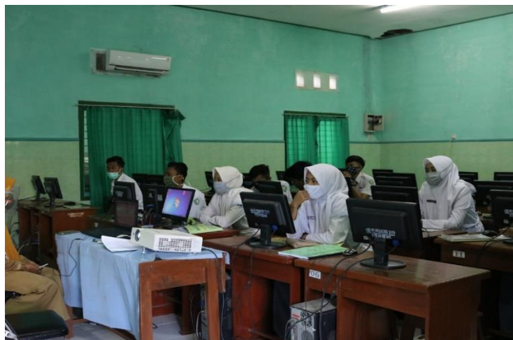
Gambar 4.1 Kegiatan program prodistik. 46

Dari hasil observasi yang dilakukan pada hari Kamis tanggal 4 Maret 2021 peneliti melihat siswa di lab komputer sedang diberikan materi pelajaran seputar komputer yang merupakan bagian dari program prodistik. Selain itu peneliti juga melihat kondisi madrasah yang bersih dan asri. Untuk kegiatan rutinitas madrasah, terlihat adanya rutinitas pembacaan doa sebelum memulai pembelajaran, rutinitas lainnya ialah petugas kebersihan sedang merawat tumbuhan yang ada di madrasah. 45 Hal ini diperkuat dengan adanya dokumentasi foto dan tabel 4.2 yang peneliti peroleh ketika observasi langsung.