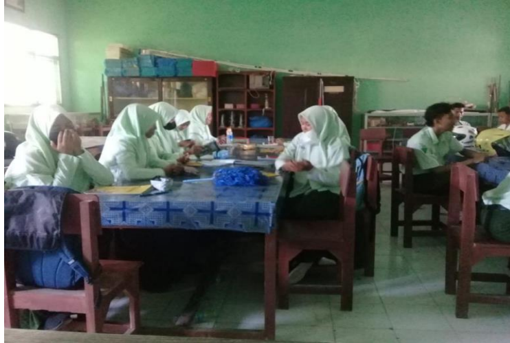
Gambar 4.2 Pembiasaan rutin membaca doa sebelum dan sesudah berakhirnya pelajaran. 47

Gambar 4.2 merupakan kegiatan pembiasaan rutin berupa pembacaan doa sebelum dan berakhirnya pelajaran sebagai suatu upaya agar peserta didik terbiasa ketika memulai suatu aktivitas harus selalu diawali dengan doa, dengan begitu nantinya akan timbul sifat religius utamanya dalam ahlak.