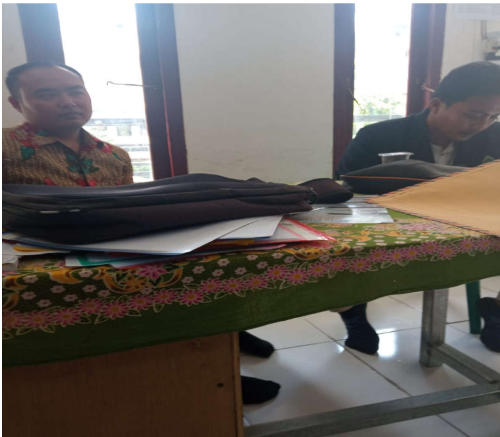
Gambar 4. Wawancara dengan Kepala Sekolah SMK Sumber Bungur Pakong Pamekasan