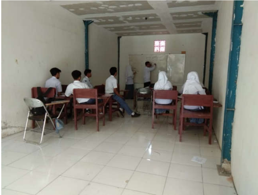
Gambar 1. Kegiatan belajar siswa.