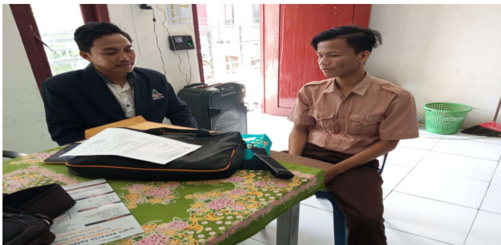
Gambar 6. wawancara dengan siswa kelas IX