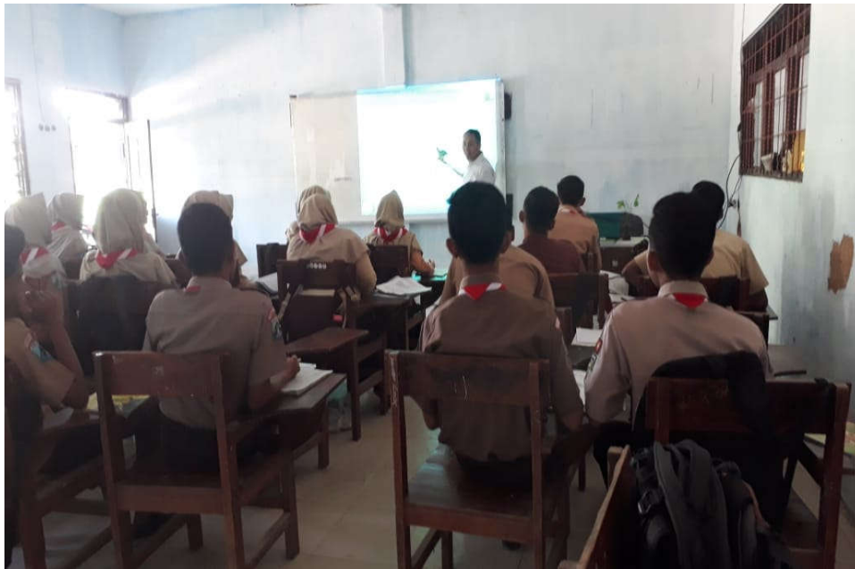
Gambar 2. Pemberian motivasi terhadap siswa dengan menggunakan layanan informasi audio visual