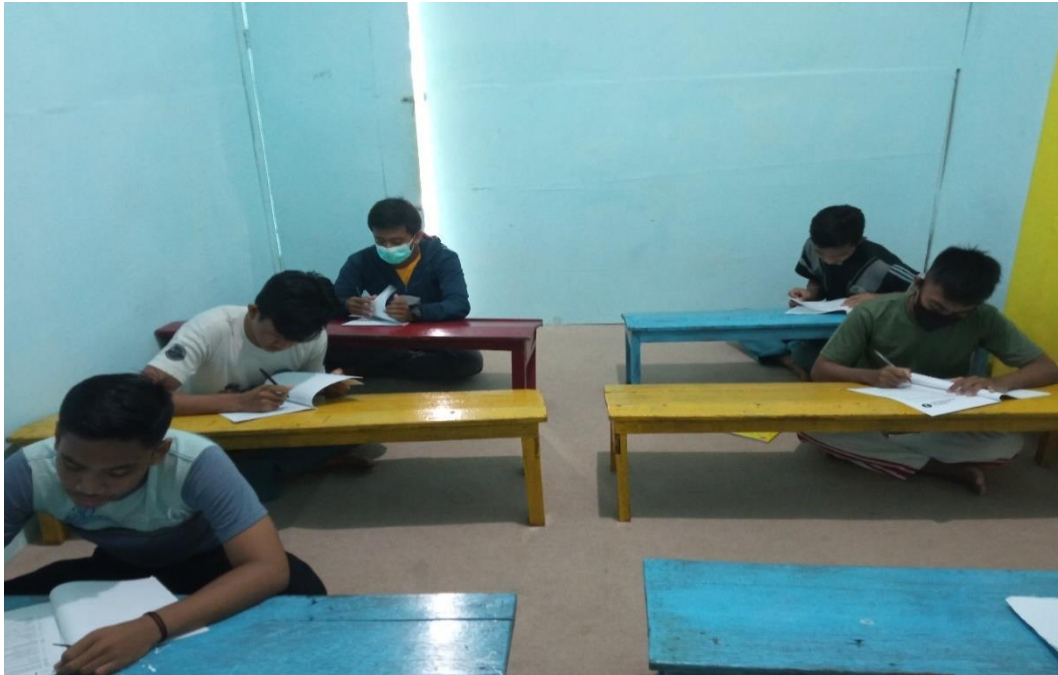
The students do the TOEFL Test