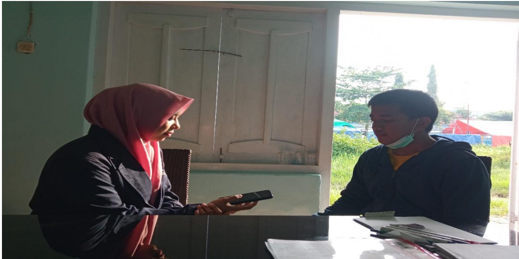
The interview with student