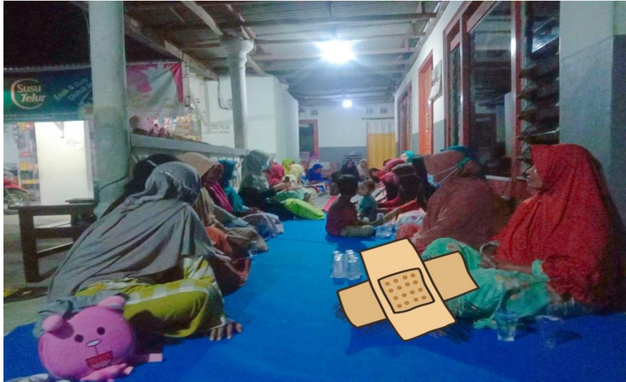
Foto pada saat wawancara