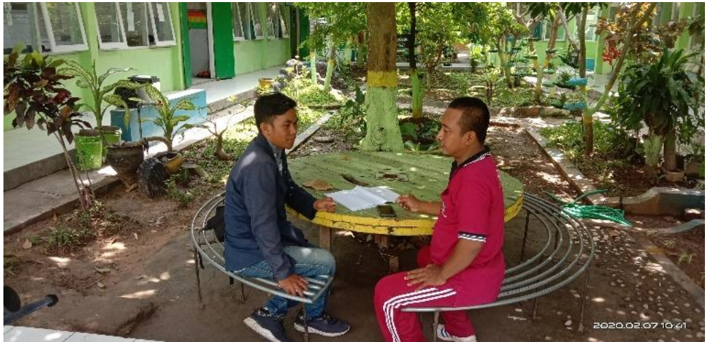
3. Foto saat wawancara dengan Bimbingan Konseling