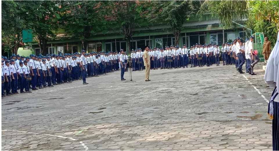
13. Foto saat siswa melanggar tata tertib