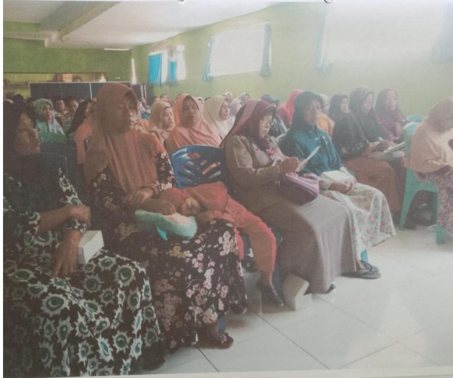
15. Foto saat rapat dengan seluruh guru