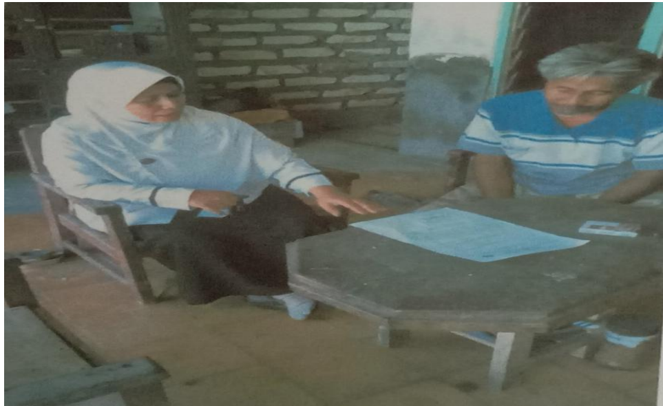
19. Foto saat wawancara denga siswa