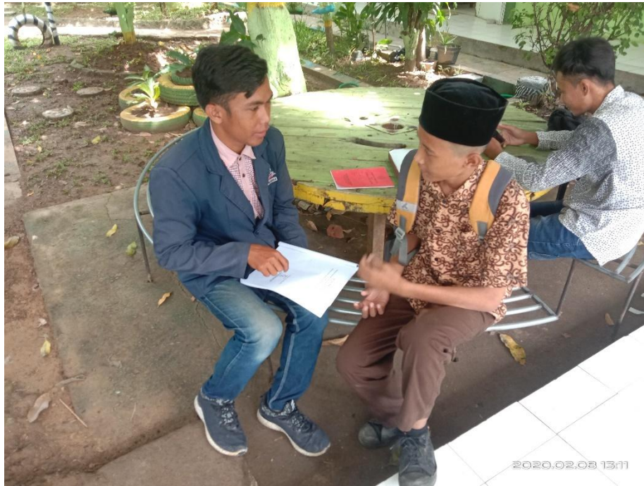
20. Foto pengelompokan peserta didik kelas tahfidz