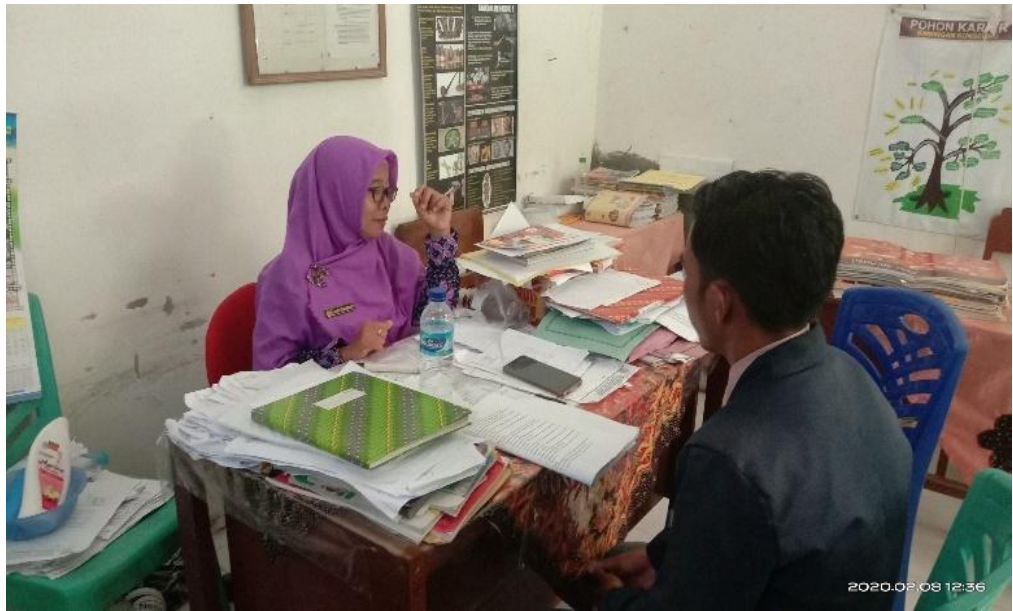
4. Foto saat wawancara dengan guru Bahasa Indonesia