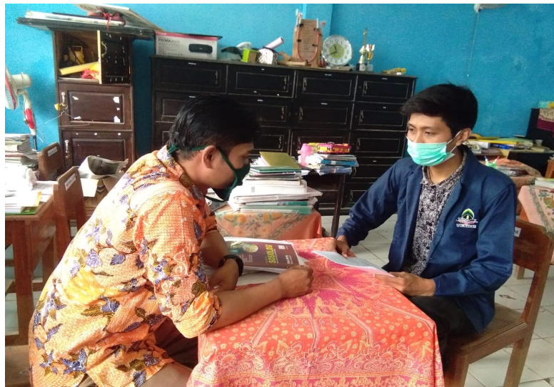
e. Foto Wawancara dengan Waka Kesiswaan