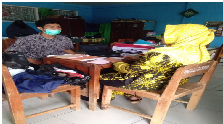
f. Foto Rapat Rencana Pembelajaran