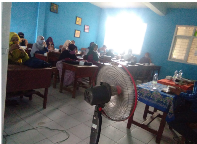
c. Foto Masa Aktif Sekolah