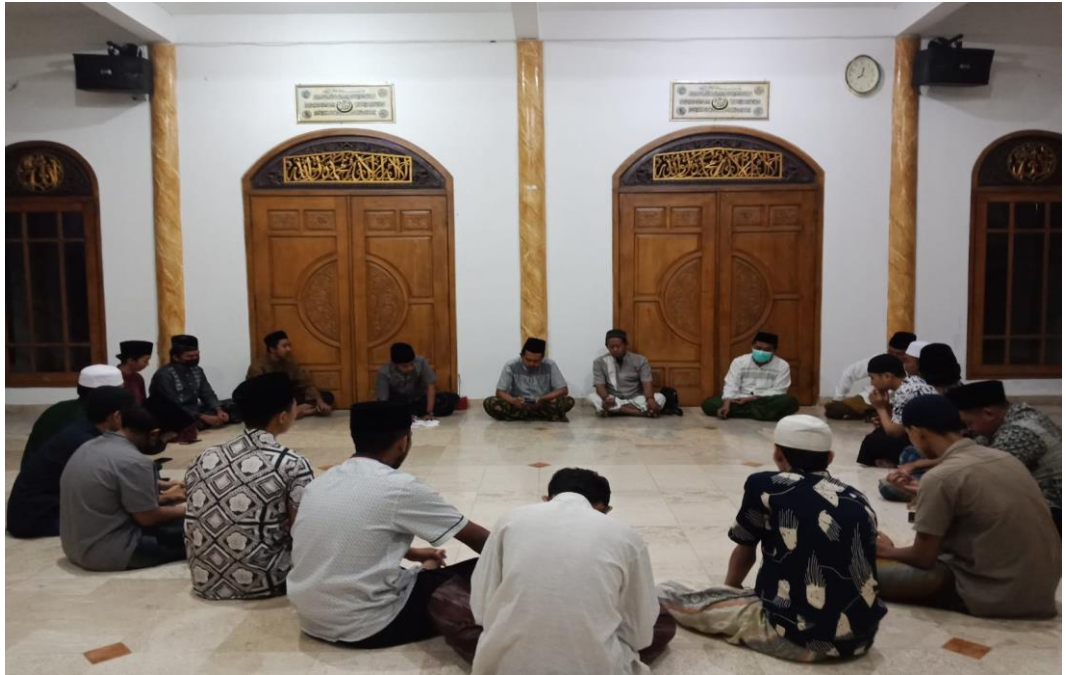
Gambar 4.2 Keadaan program kegiatan dzikir sholawat remaja masjid Al-Hikmah

Dari beberapa keterangan gambar diatas tersebut, dapat disimpulkan bahwasanya Penerapan progam dzikir sholawat mampu mengatasi perilaku menyimpang dan mampu membuat jiwa lebih tenang serta dekat kepada Allah. Terlihat dari para remaja yang khusuk serta menyesal atas perbuatannya yang menyimpang pada saat mengikuti kegiatan tersebut. Dengan mengamalkan bacaan dzikir yang sangat mudah yang terdapat pada progam dzikir sholawat tersebut. Adapun bacaan tersebut yang sering diamalkan oleh anggota remaja masjid merupakan bacaan dzikir istighfar dan sholawat atas nabi, yang terkadang dibaca sampai 100x dan 1000x. Hal tersebut dilakukan untuk memberikan ketenangan pada jiwanya serta membuat emosi lebih stabil untuk tidak berperilaku menyimpang atau melanggar dan merugikan masyarakat serta melanggar norma-norma yang berlaku.