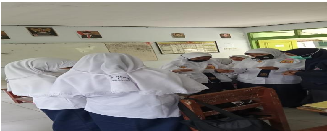
Pengambilan kartu soal