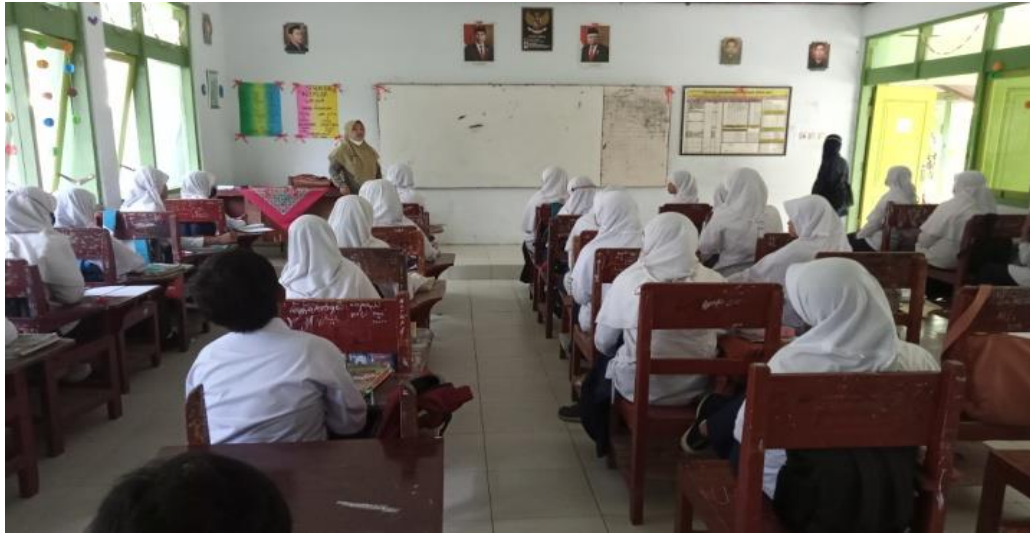
Observasi (Proses Pembelajaran)