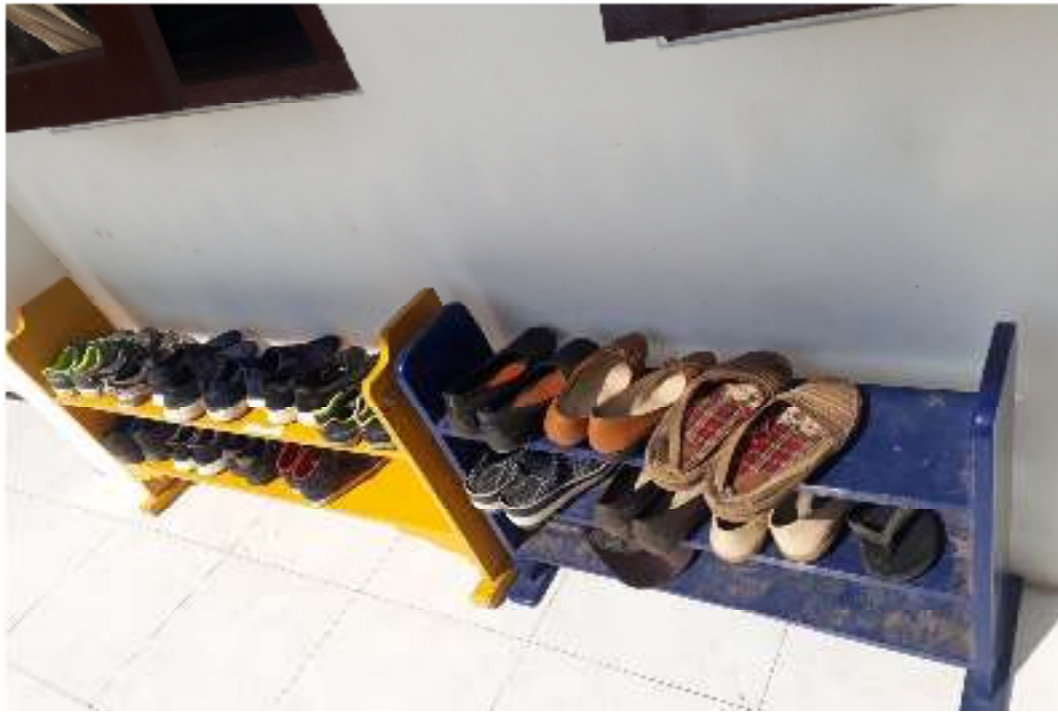
Pembiasaan Meletakkan Barang Pada Tempatnya