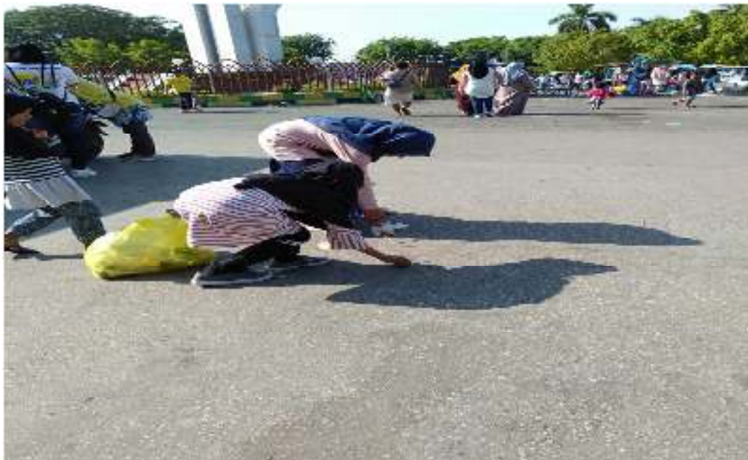
Membersihkan Sampah di Taman Arek Lancor