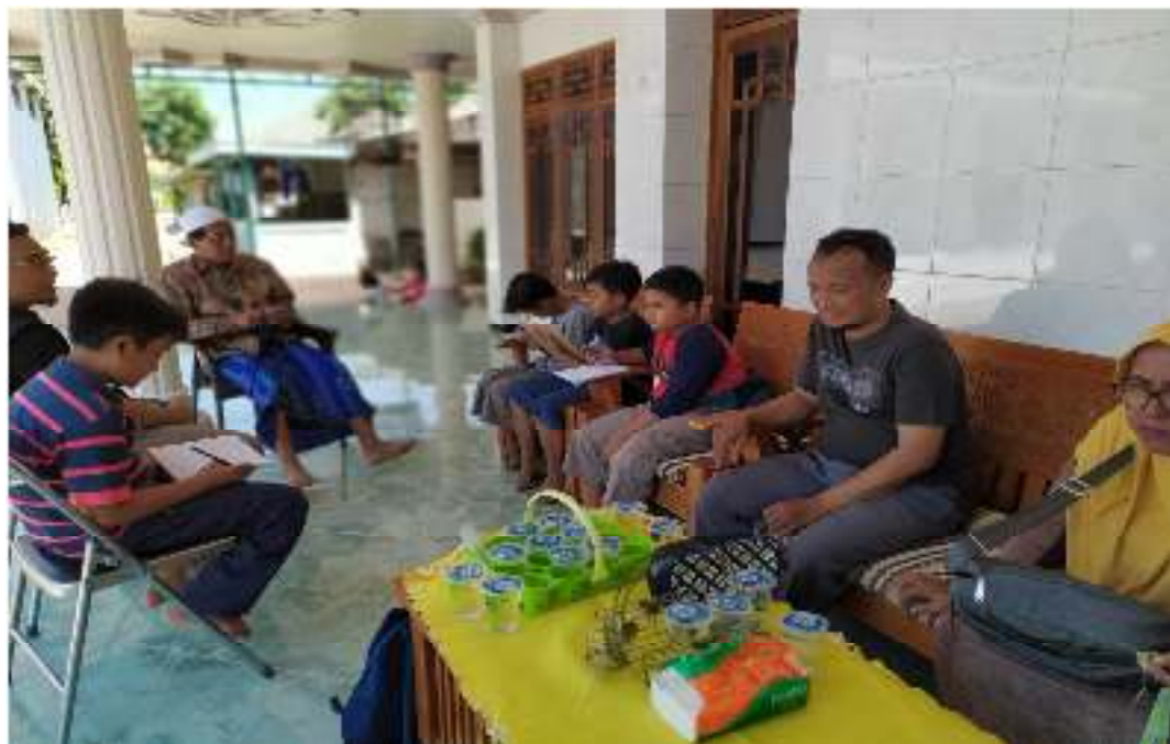
Kegiatan Wawancara SDIT Al-Uswah Pamekasan