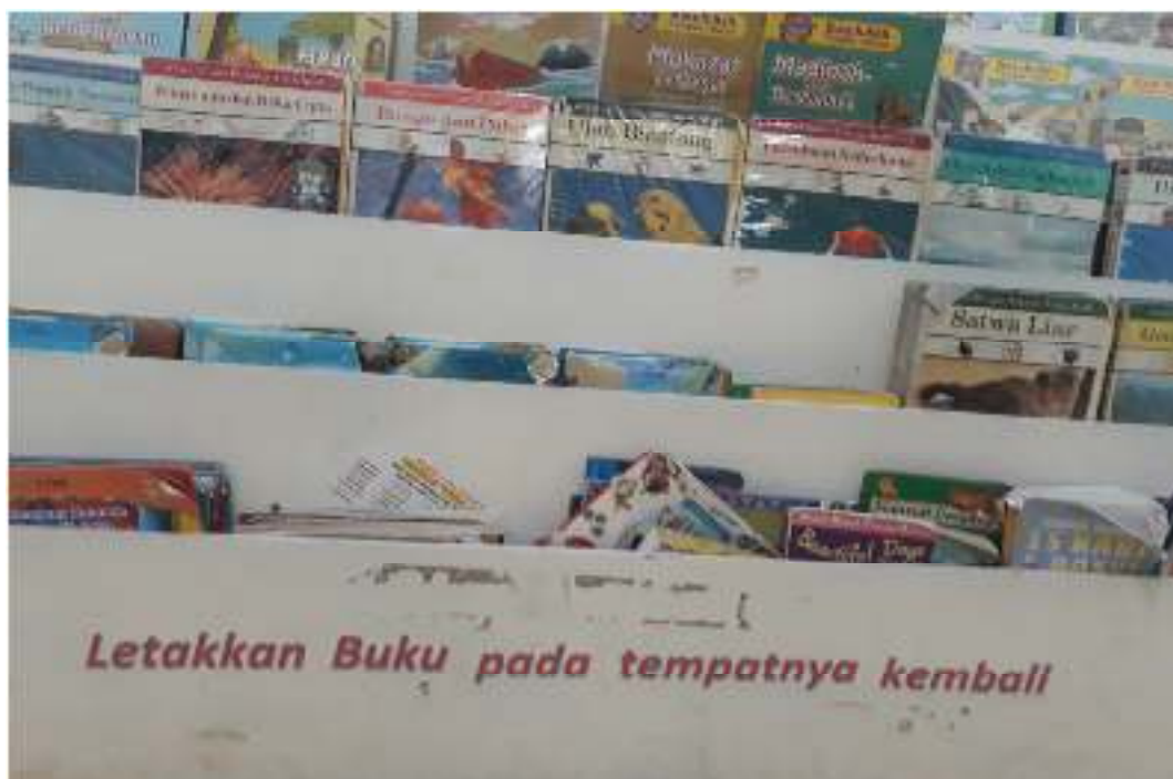
Pembiasaan Meletakkan Barang Pada Tempatnya