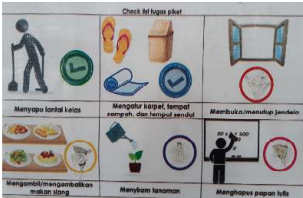
Cek List Tugas Piket