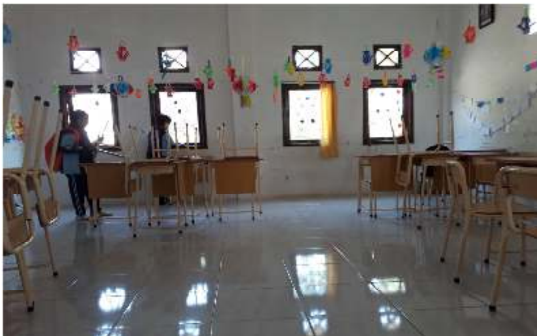
Merapikan Kembali Bangku Setelah Selesai Pembelajaran