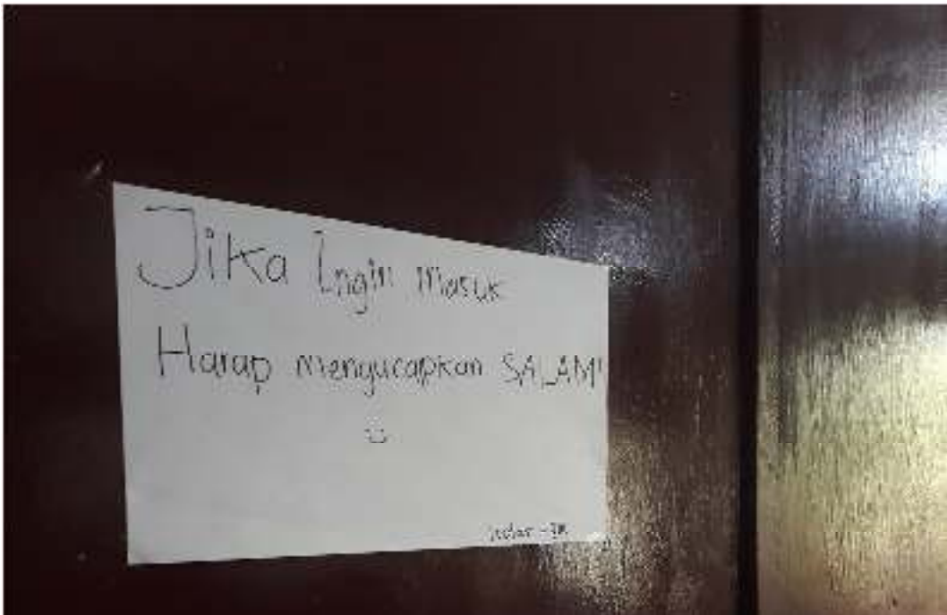
Pembiasaan Mengucapkan Salam