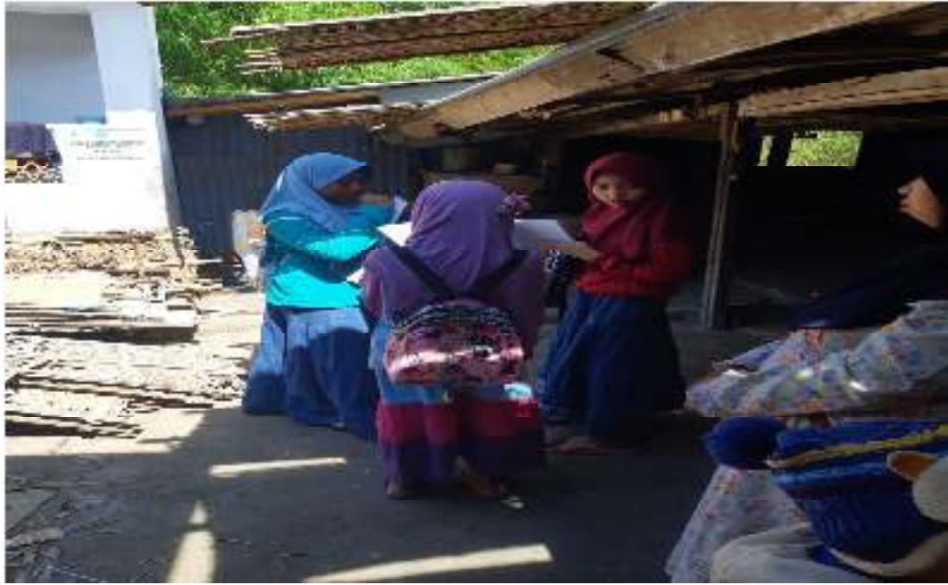
Kegiatan Wawancara SDIT Al-Uswah Pamekasan