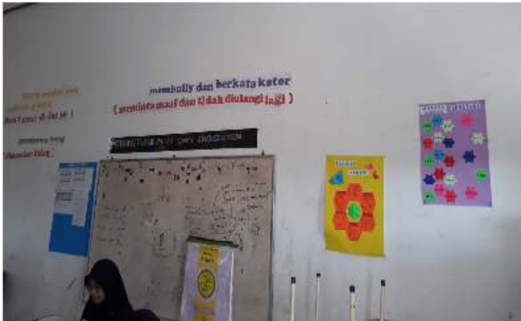
Siswa Yang Berbuat Salah Harus Minta Maaf