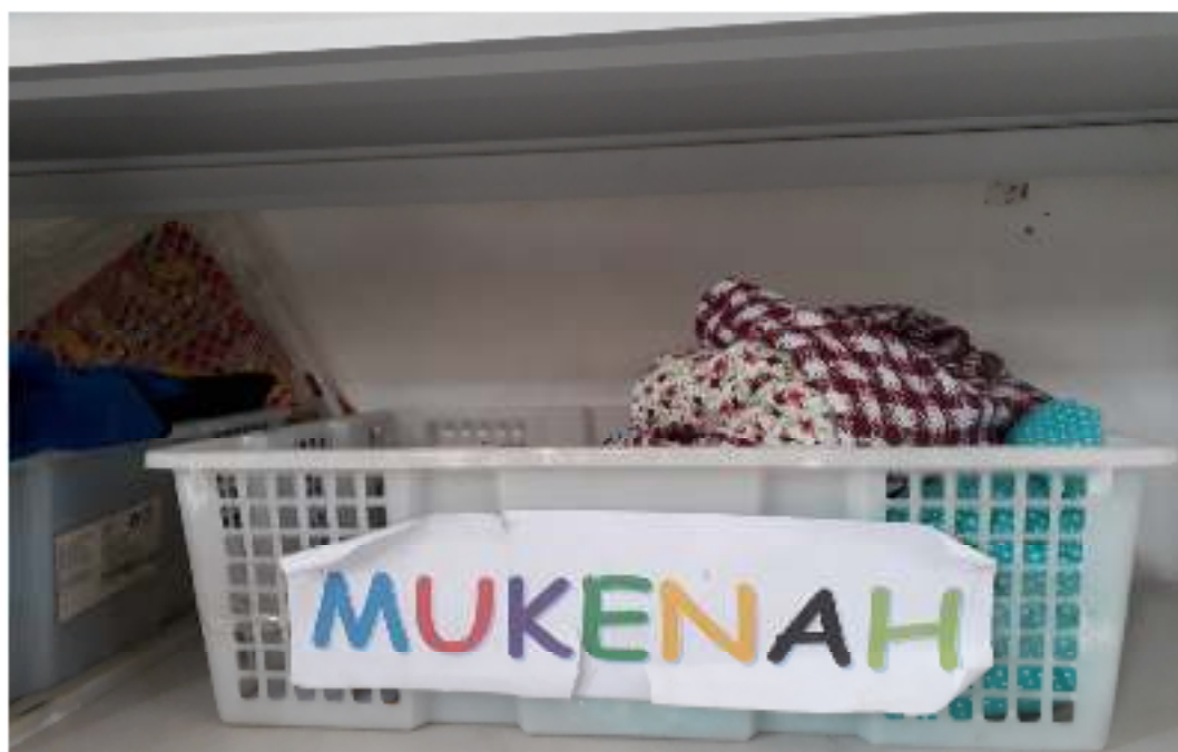
Pembiasaan Meletakkan Barang Pada Tempatnya