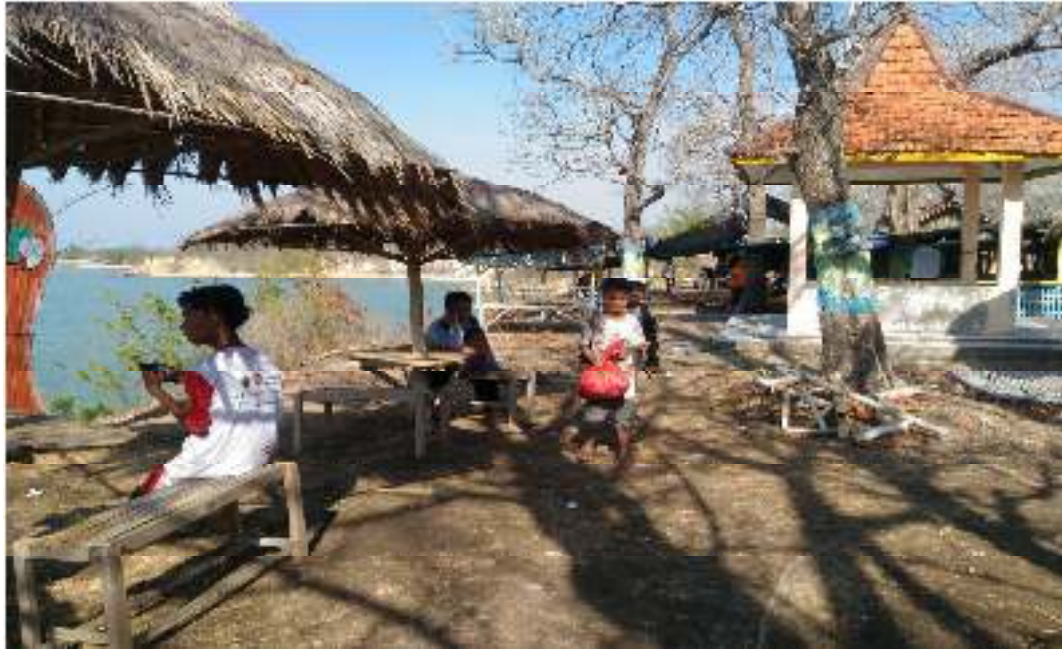
Membersihkan Sampah di Pantai Jumiang