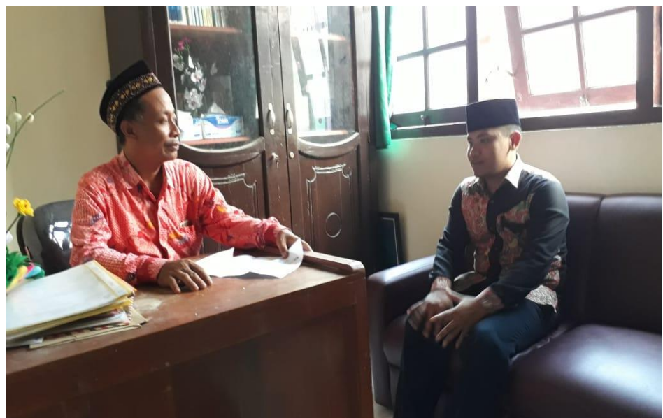
Wawancara bersama kepala sekolah MA Miftahul Qulub Polagan Galis Pamekasan