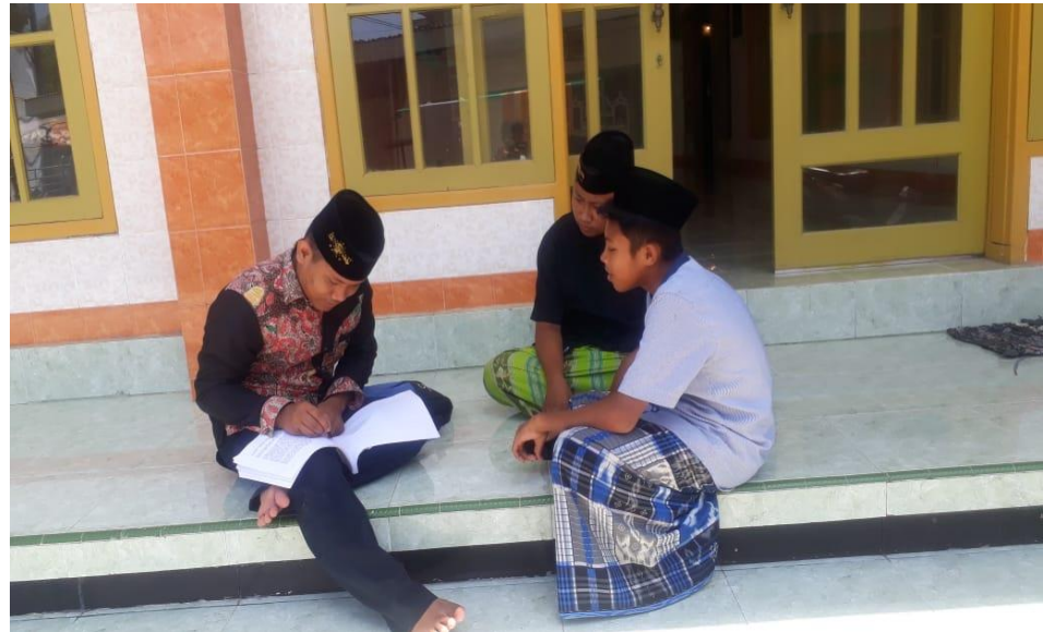
Wawancara bersama siswa MA Miftahul Qulub Polagan Galis Pamekasan