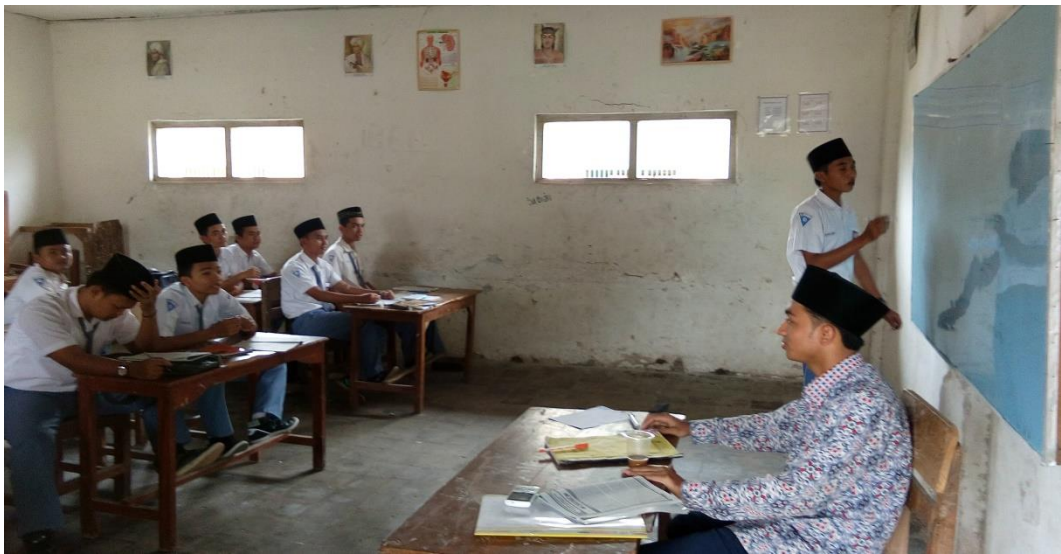
Foto kegiatan belajar mengajar di MA Miftahul Qulub Polagan Galis Pamekasan