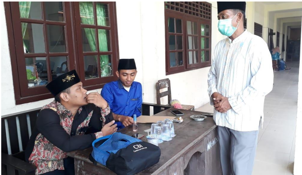
Wawancara bersama guru pamong Aqidah Akhlak MA Miftahul Qulub Polagan Galis Pamekasan