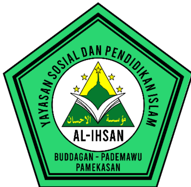
Gambar 4.1 Logo TK Al- Ihsan