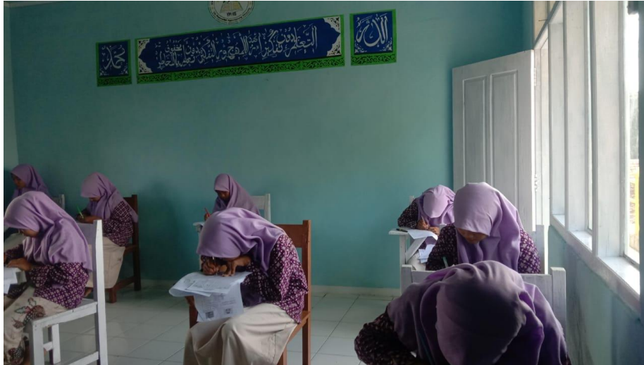
Kegiatan Belajar Mengajar