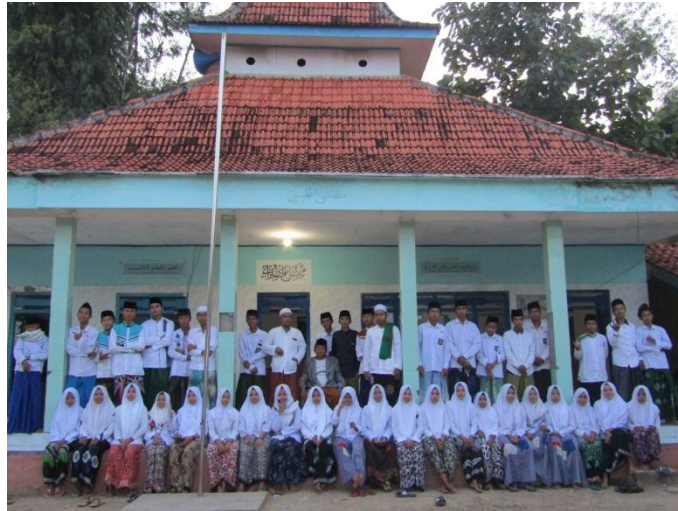
PONDOK PESANTREN BABUS SALAM