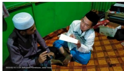
Wawancara kepada santri