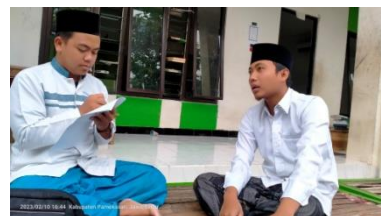
Wawancara kepada pengurus