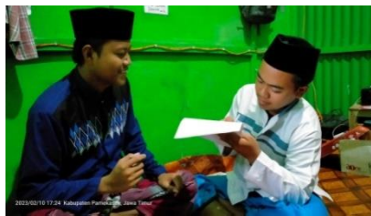
Wawancara kepada santri