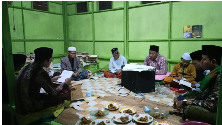
Pelaksanaan Pembacaan Enam Surah dalam Tradisi Jailanian