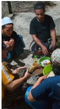
Membaca fatihah/tawasul sebelum memasak