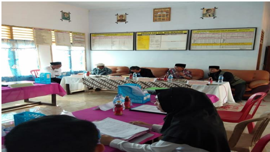
Foto pada saat wawancara dengan kepala sekolah