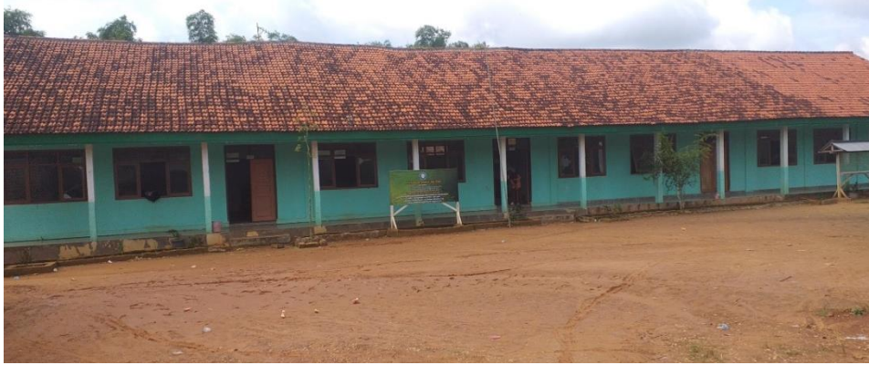
Foto Ruangan Kantor Guru