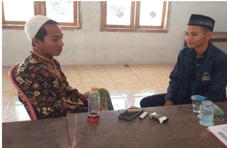
Foto saat proses KBM Berlangsung