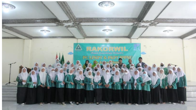
Partisipasi PKPT IAIN Madura dalam Rakorwil PC LPKPT