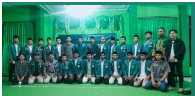
Kongkow PKPT se-korda Madura