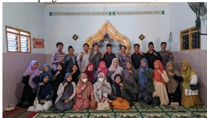
Peringatan isro' mi'roj atau realisasi proker PHBI oleh departemen dakwah