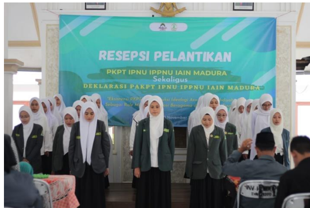
Resepsi pelantikan kepengurusan baru PKPT IPPNU IAIN Madura 2022-2023