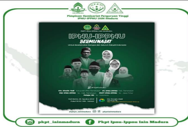
Kegiatan IPNU IPPNU Bermunajat yang dilaksanakan via Google meet