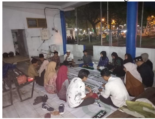
Buka bersama sekaligus musyawarah pelaksanaan kegiatan makesta IV PKPT IAIN Madura