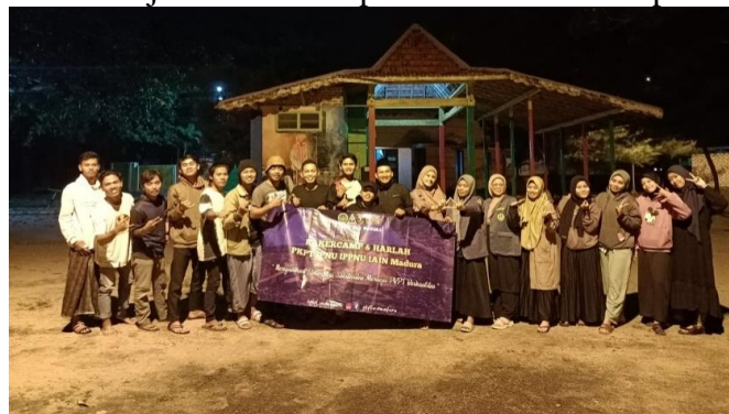
Rapat kerja bersama dalam penyusunan program kerja yang dibungkus dalam acara camping bersama di Pantai Talang Siring