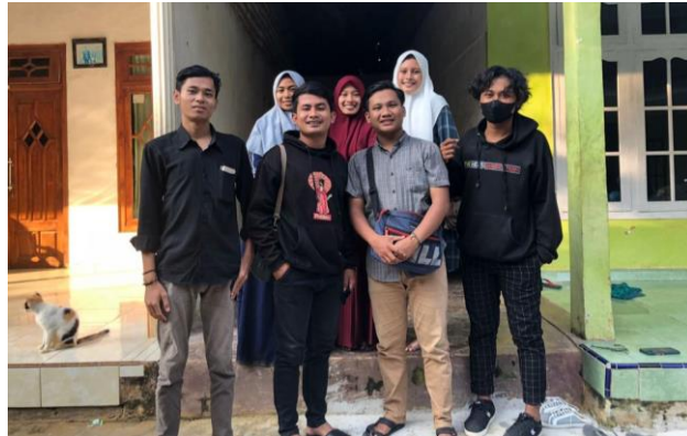
Silaturahmi ke rumah anggota ataupun Pembina PKPT IAIN Madura