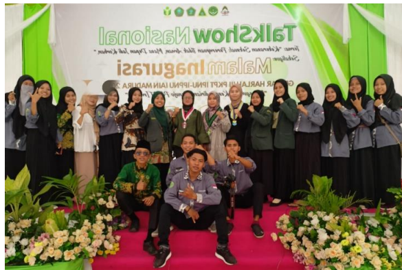
Puncak harlah PKPT IAIN MADURA sekaligus talkshow nasional