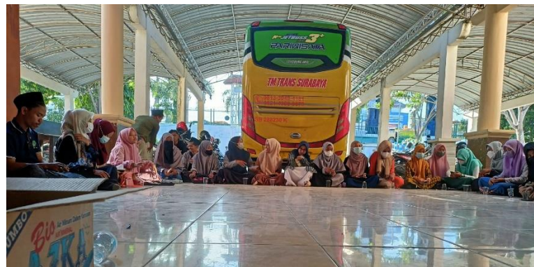
Kajian yang menjadi realisasi program kerja divisi lembaga kajian dan pengembangan (LKP)