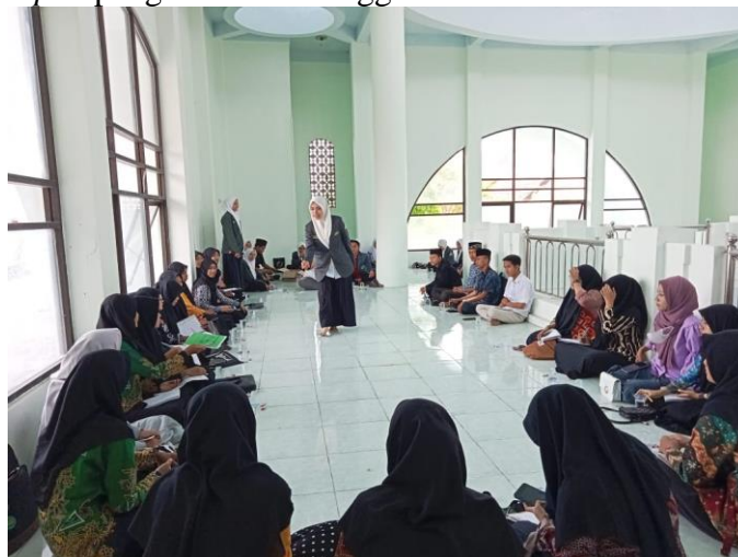
Open recruitment kepengurusan yang diisi dengan sosialisasi materi wajib IPNU IPPNU, ke Aswaja-an, serta tipologi mahasiswa dan antropologi kampus.