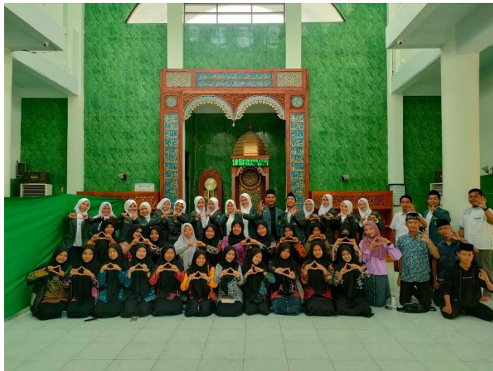
Meet Up kepengurusan dan anggota baru PAKPT IAIN Madura