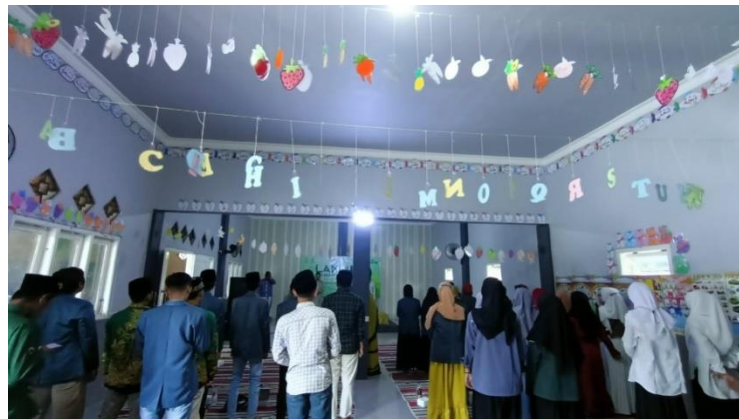
Kegiatan latihan kader muda (LAKMUD) salah satu realisasi proker departemen kaderisasi