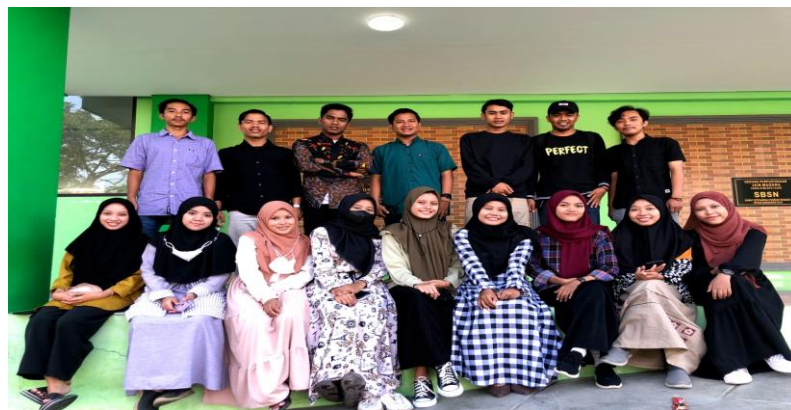
Rapat evaluasi sekaligus pembentukan panitia seminar Harlah IPNU IPPNU