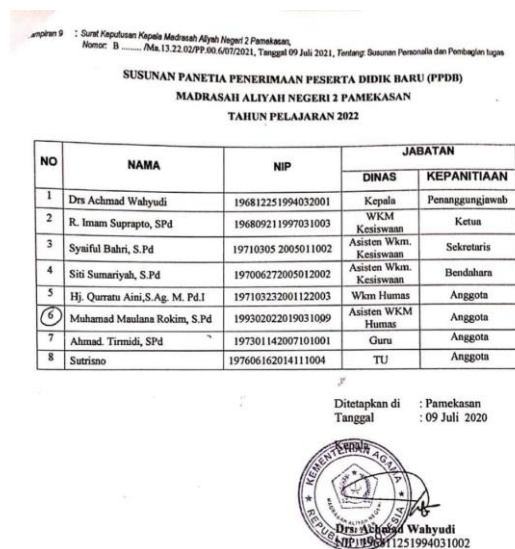
Gambar 4.1 susunan panitia PPDB tahun ajaran 2022 MAN 2 Pamekasan

Pamekasan tahun pelajaran 2022 dan brosur PPDB jalur prestasi MAN 2 Pamekasan tahun pelajaran 2022, sebagaimana terlampir,