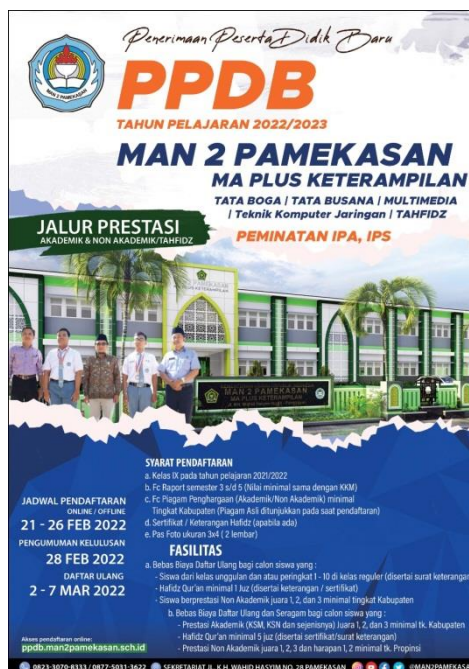
Gambar 4.2 brosur PPDB tahun ajaran 2022 MAN 2 Pamekasan