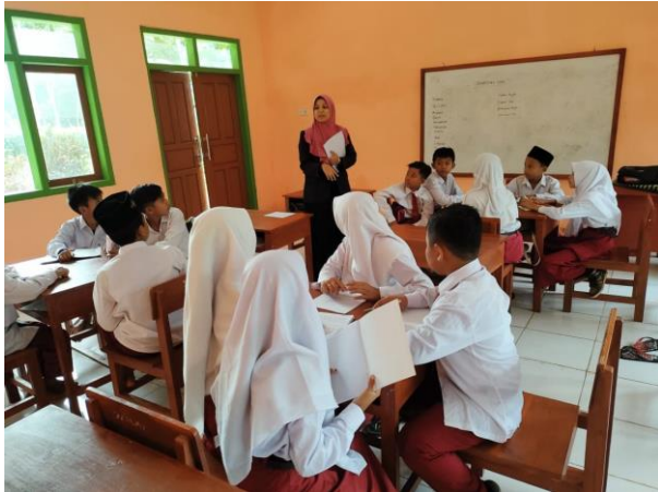
Gambar 7: peneliti menjelaskan materi yang diberikan