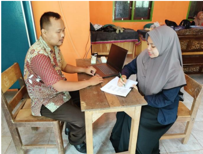
Gambar 3: wawancara juga dilakukan dengan salah satu guru kelas