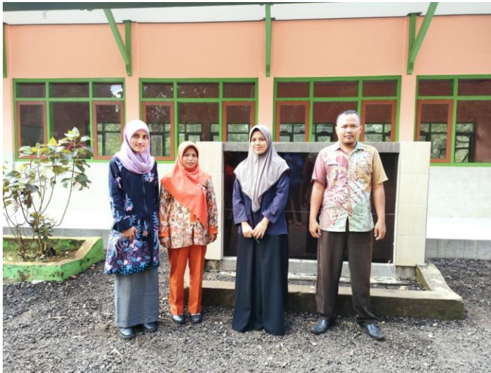
Gambar 1: peneliti melakukan sesi foto dengan beberapa guru SDN Bulangan Barat 2