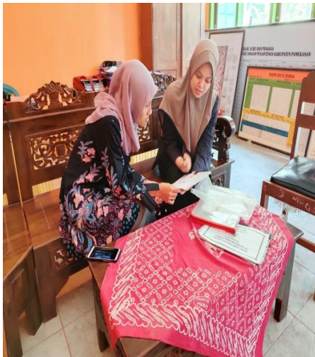
Gambar 2: peneliti melakukan wawancara dengan salah seorang guru