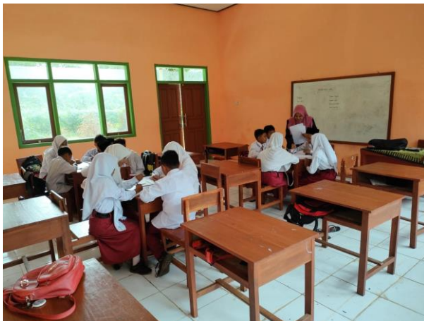
Gambar 6: peneliti sedang membantu siswa dalam mengerjakan pekerjaan sekolah