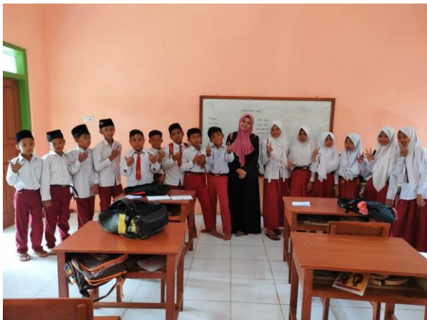
Gambar 8: peneliti melakukan sesi foto bersama siswa kelas V SDN Bulangan Barat