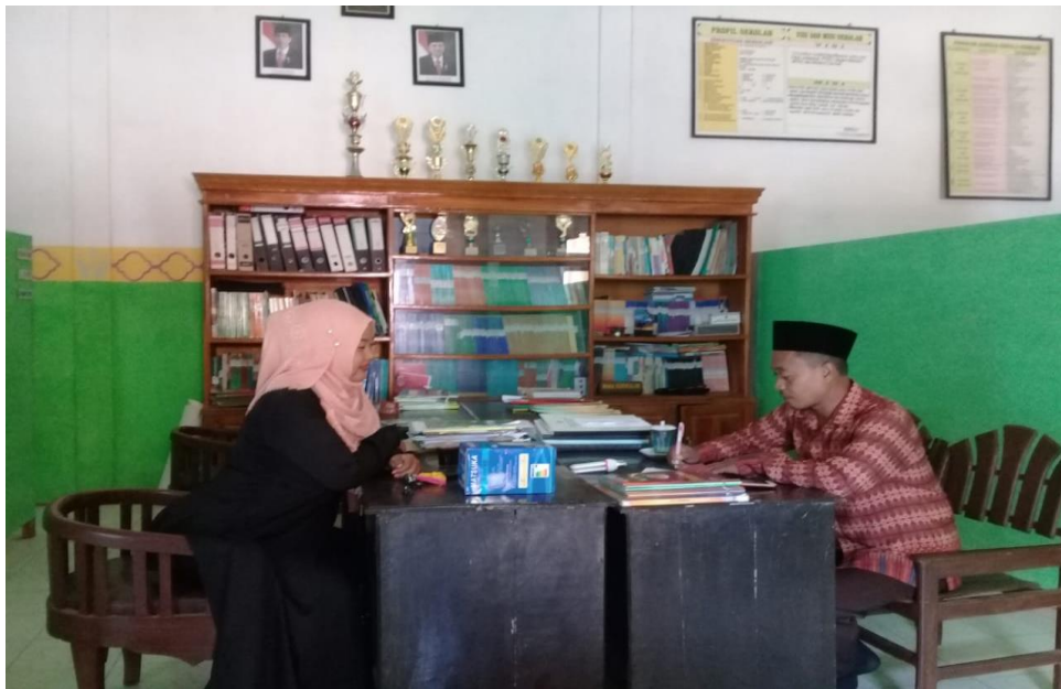
(Foto Bersama dengan Kepala Madrasah MA Tarbiyatun Nasyiin 1 Grugujan)