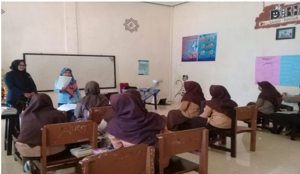
(Guru BK saat Melaksanakan Layanan Klasikal)