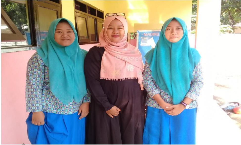
(Foto Bersama dengan Respobden/ siswa MA Tarbiyatun Nasyiin 1 Grujungan)