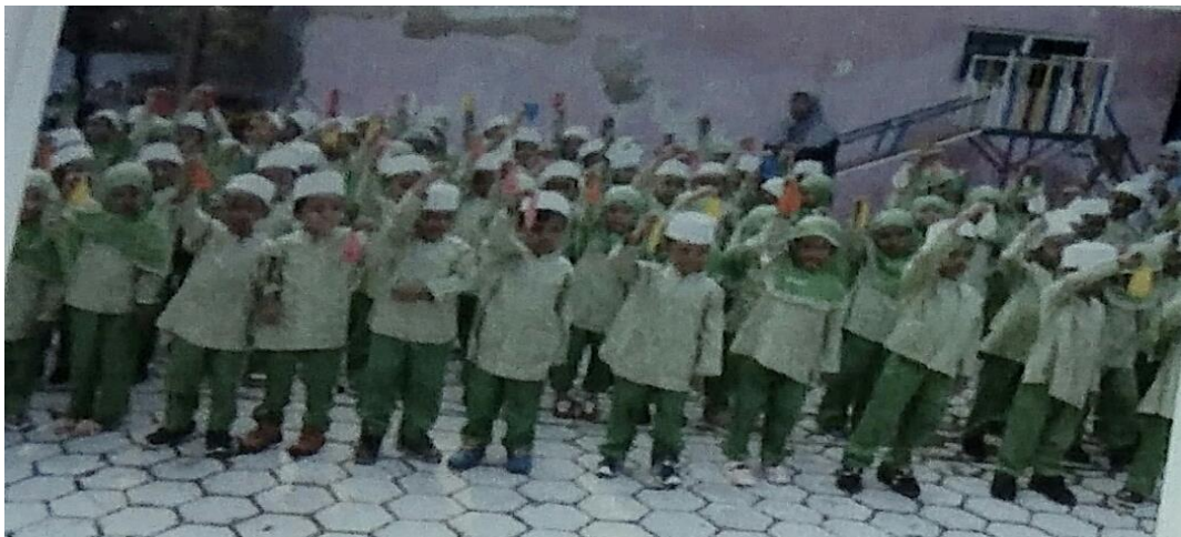
Anak-anak meniup balon