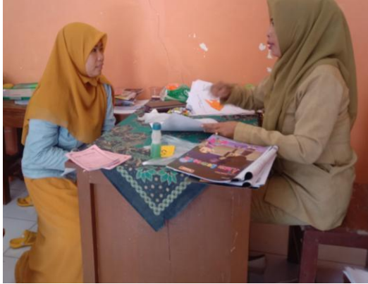
foto saat wawancara kepala sekolah dan guru