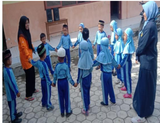
Foto siswa saat main bakiak tunggal