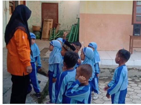
foto siswa bermain dakon