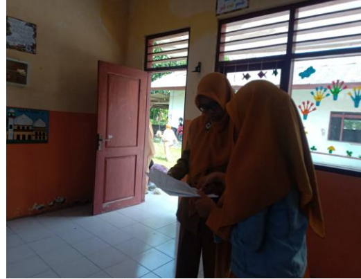
foto saat guru menjelaskan permainan yang akan dimainkan