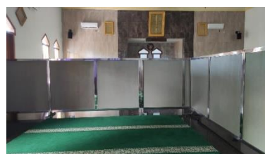
Tempat shalat wanita

Berdasarkan hasil wawancara dan observasi yang dilakukan oleh peneliti di tempat lokasi penelitian secara langsung memang benar bahwasannya fasilitas-fasilitas ibadah berupa masjid yang ditawarkan Hotel Syariah Cahaya Berlian Pamekasan sesuai dengan kriteria konsep pariwisata halal. Terdapat beberapa hasil dokumentasi yang di peroleh peneliti pada saat melakukan observasi di lokasi penelitian sebagai berikut: 18