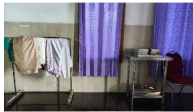
Perlengkapan ibadah wanita