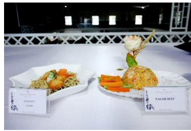
Spagetti Agel &amp; Nagor Sexy