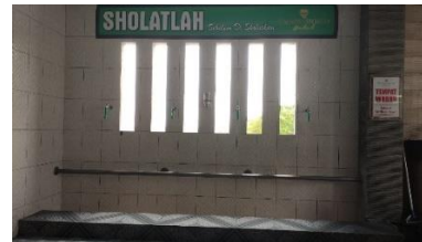
Tempat wudhu pria