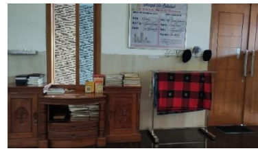
Perlengkapan ibadah pria