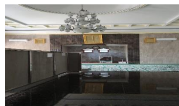
Tempat shalat pria