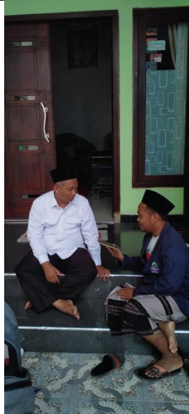
FOTO SAAT WAWANCARA BERSAMA KETUA YAYASAN PONDOK PESANTREN NURUL JADID