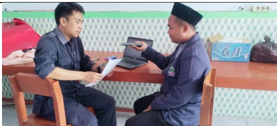
WAWANCARA BERSAMA KEPALA SEKOLAH SMA ISLAM NURUL JADID