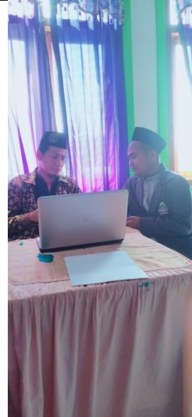
FOTO WAWANCARA BERSAMA KEPALA SEKOLAH SMP ISLAM NURUL JADID