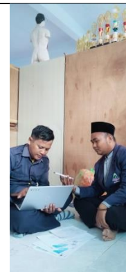
WAWANCARA CARA BERSAMA WAKA