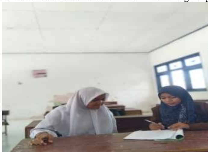
(Foto wawancara bersama Siswi SMPN 1 Pangarengan)