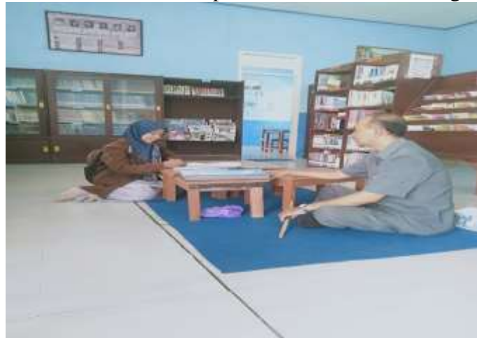
(Foto wawancara bersama Guru PAI SMPN 1 Pangarengan)