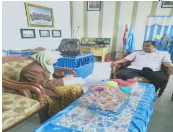
(Foto wawancara bersama Kepala Sekolah SMPN 2 Pangarengan)