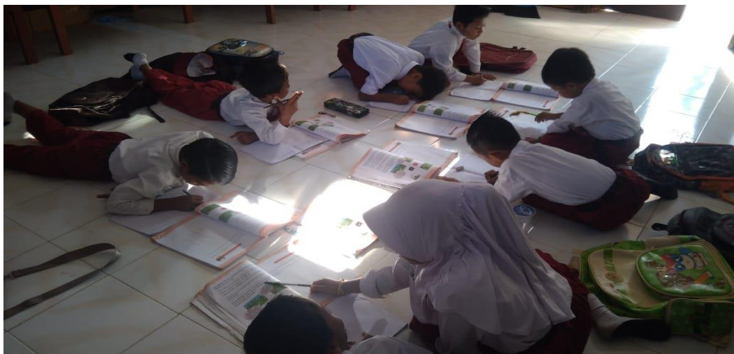
Belajar di Perpustakaan SDN Ban Ban