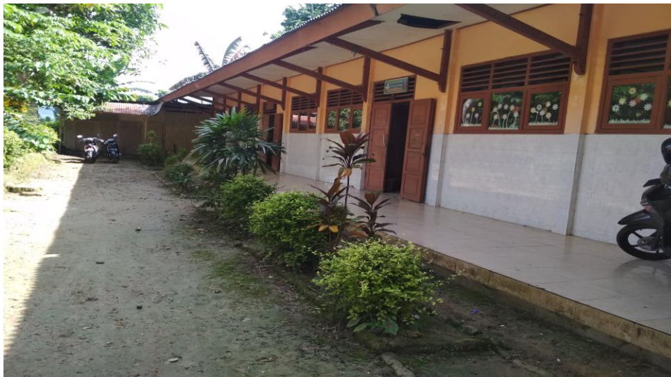
Lingkungan sekolah SDN Ban Ban