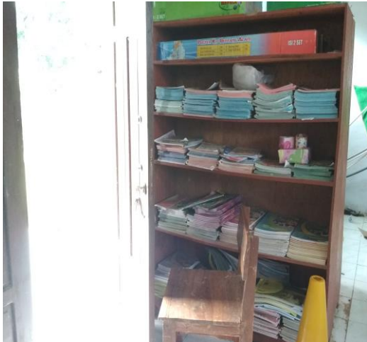
Buku di Perpustakaan SDN Ban Ban