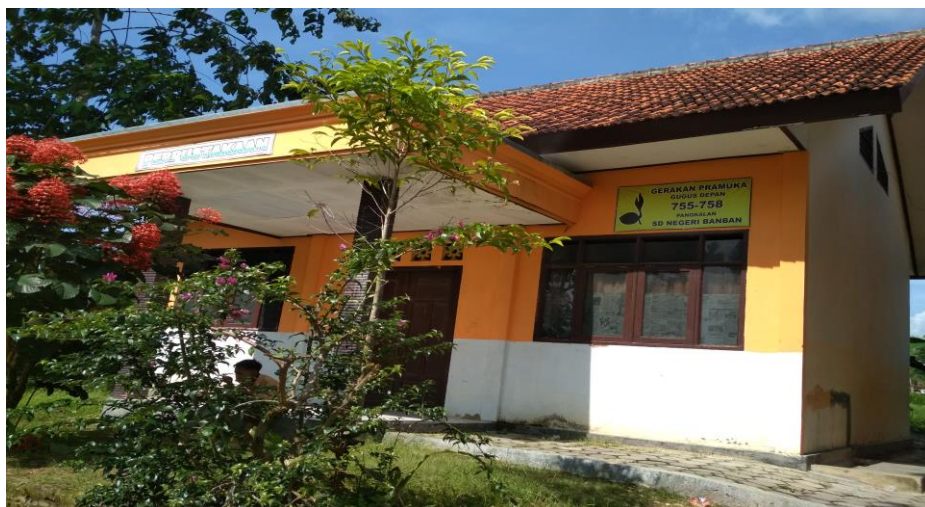
Perpustakaan Sekolah SDN Ban Ban