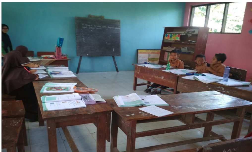
Kegiatan Belajar Mengajar Kelas I SDN Ban Ban