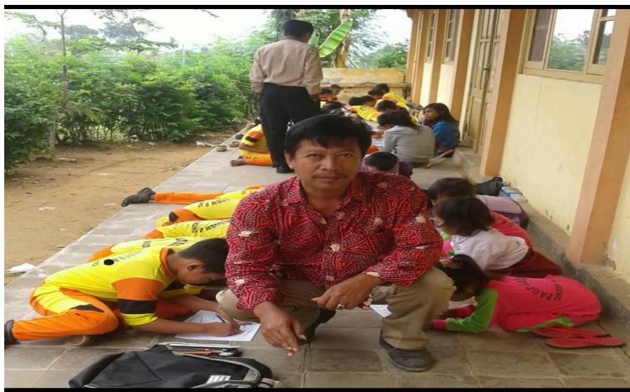
Belajar di Luar Kelas SDN Ban Ban