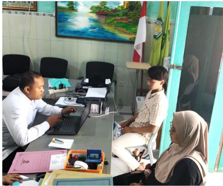
Gambar 4.4 Calon Peserta Didik Mendaftar Offline

Berdasarkan dokumentasi di atas bisa peneliti ketahui bahwa MAN 1 Pamekasan sama-sama mengimbangi dan juga memfasilitasi pendaftaran dengan adanya pendaftaran online dan juga offline . Sehingga calon peserta didik baru akan memilih salah satu diantara keduanya. Tidak hanya itu, pendaftaran offline juga menjadi solusi bagi calon siswa yang mempunyai kendala untuk melakukan pendaftaran online .