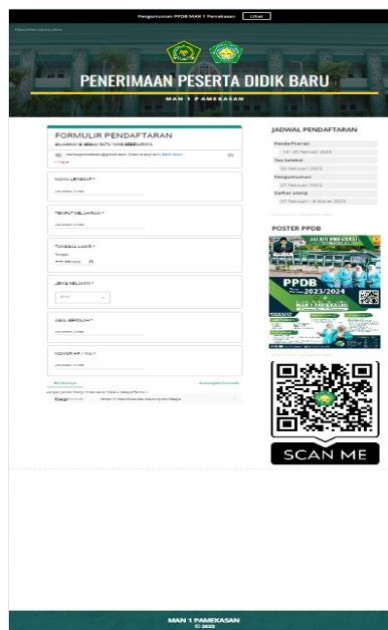
Gambar 4.3 Screenshot Penampakan E-PPDB

Berdasarkan hasil dokumentasi di atas peneliti mengetahui bahwa pendaftaran online bisa dilakukan dengan link yang sudah disiapkan oleh lembaga atau bisa juga langsung mengunjungi website MAN 1 yaitu www.manjccpmk.sch.id . Dari sana dapat ditemukan seperti apa penampakan formulir pendaftaran online di MAN 1 Pamekasan. Dimana penampakan tersebut terdiri dari 6 data diri calon peserta didik yang harus diisi yaitu, nama, tempat lahir, tanggal lahir, jenis kelamin, asal sekolah, dan nomer WhatsApp. Nomer WhatsApp tersebut akan digunakan untuk pembuatan grup khusus untuk calon siswa baru yang bertujuan untuk lebih mempermudah mengkoordinasi ke depannya seperti apa.