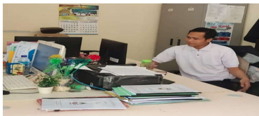
Gambar 4.5 Proses Menstabilkan Jaringan di Pusat Data

“layanan surat secara online yaitu bagus, karena kita tidak perlu mengantri di akademik untuk mendapatkan nomer surat, tetapi dalam layanan surat yang kurang saya suka jika menanyak ke akses tersebut yaitu ketika lemot, nomer surat tidak muncul terjadi error. Kemudian bagusnya lagi dalam layanan surat online ini orang yang mengelola surat tersebut seperti Bapak Affan seharusnya selalu stanbay supaya tidak terlalu lama untuk mengelola sehingga muncul lagi.”