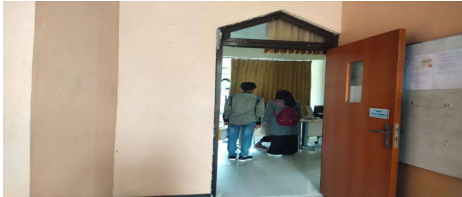
Gambar 4.7 Suasana Mahasiswa Sedang Berada di Ruang Akademik