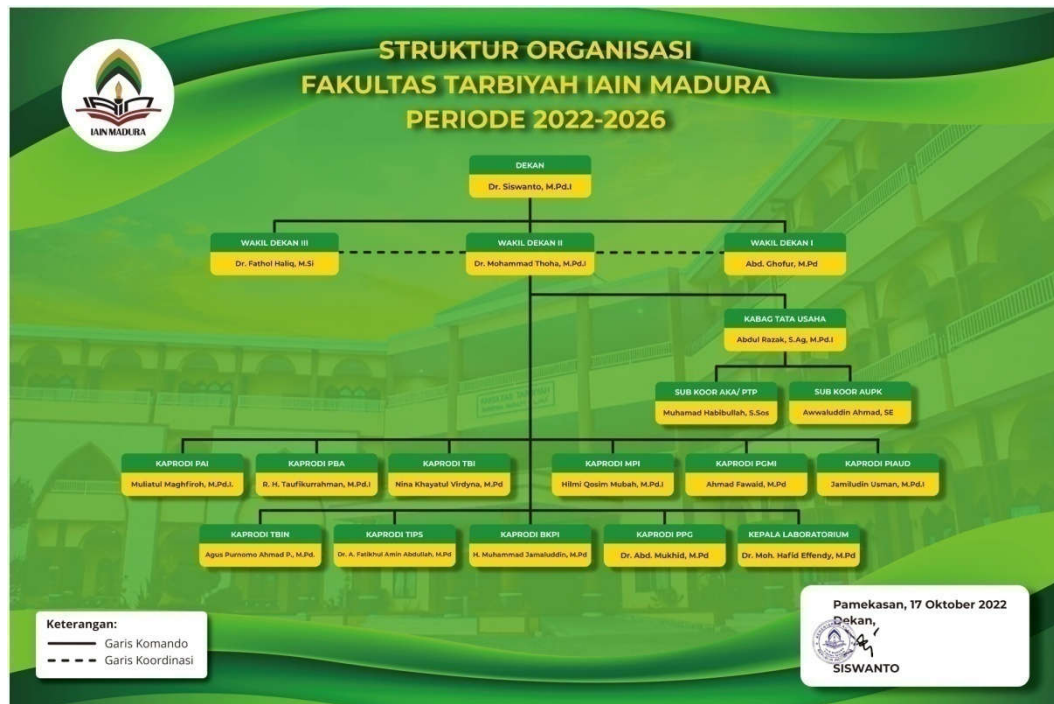
Gambar 4.2 Struktur Organisasi Fakultas Tarbiyah IAIN Madura Periode 2022 – 2026