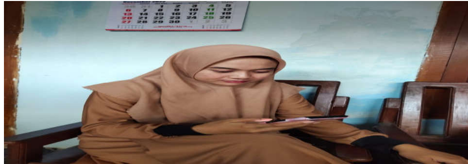
Gambar 4.8 Mahasiswa Sedang Mengambil Nomor Surat

Menurut Nuril Fitria Hidayati bahwasanya: