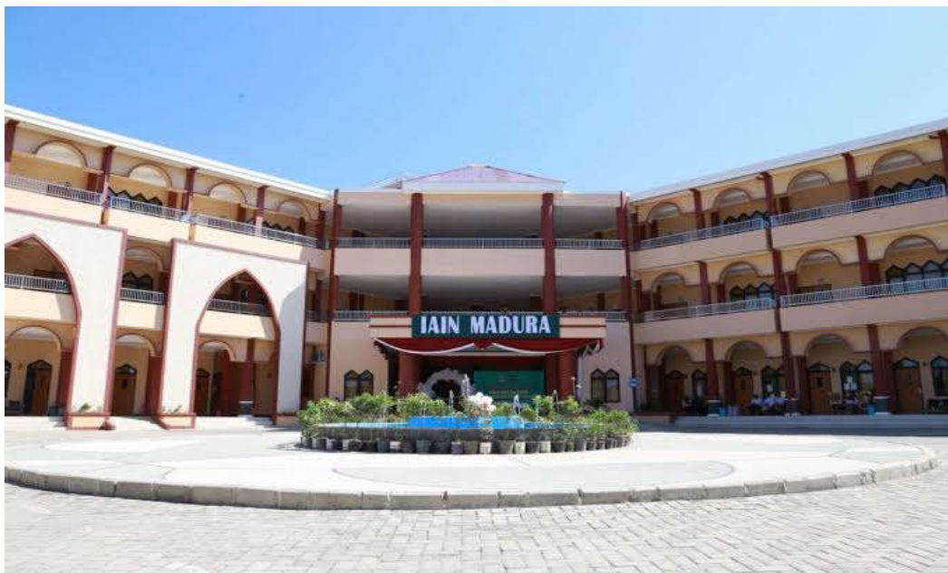
Gambar 4.1 Fakultas Tarbiyah IAIN Madura