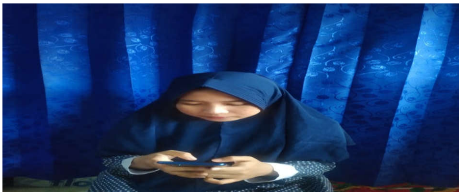
Gambar 4.6 Mahasiswa sedang Mengambil Nomor Surat secara Online

Pada hari sabtu tanggal 11 November 2022 bahwa ada mahasiswa yang sedang mengambil surat tanpa ke ruang akademik tetapi mahasiswa tersebut mendownload surat online dari dalam ruangan rumahnya sendiri sehingga mudah untuk dilaksanakan.