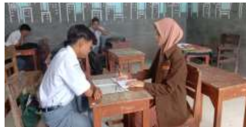
(Wawancara dengan Siswa Siswi X A SMA Raudlatul Ulum Kapedi)