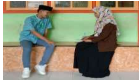
(Wawancara dengan Siswi XII B dengan Siswa XII A MA An-Najah 1 Karduluk)