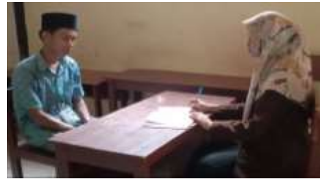
(Wawancara dengan Siswi XII B MA dengan Siswa XII A MA An-Najah 1 Karduluk)