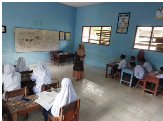
Gambar 4.2 proses belajar mengajar dalam kelas. 40

Berdasarkan hasil observasi lanjutan yang dilakukan peneliti pada tanggal 19 september 2022 peneliti mengobservasi secara langsung proses belajar mengajar di dalam kelas pada saat itu pendidik sedang melakukan pendalaman materi teks eksplanasi yang sudah dikirim dan dipelajari pada pertemuan sebelumnya di grup WhatsApp , pada saat itu praktik menulis teks eksplanasi.