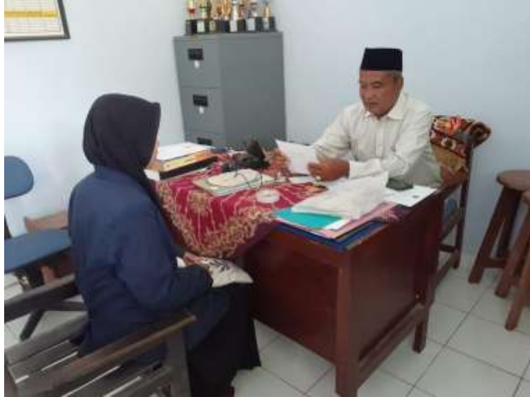
Wawancara dengan kepala sekolah