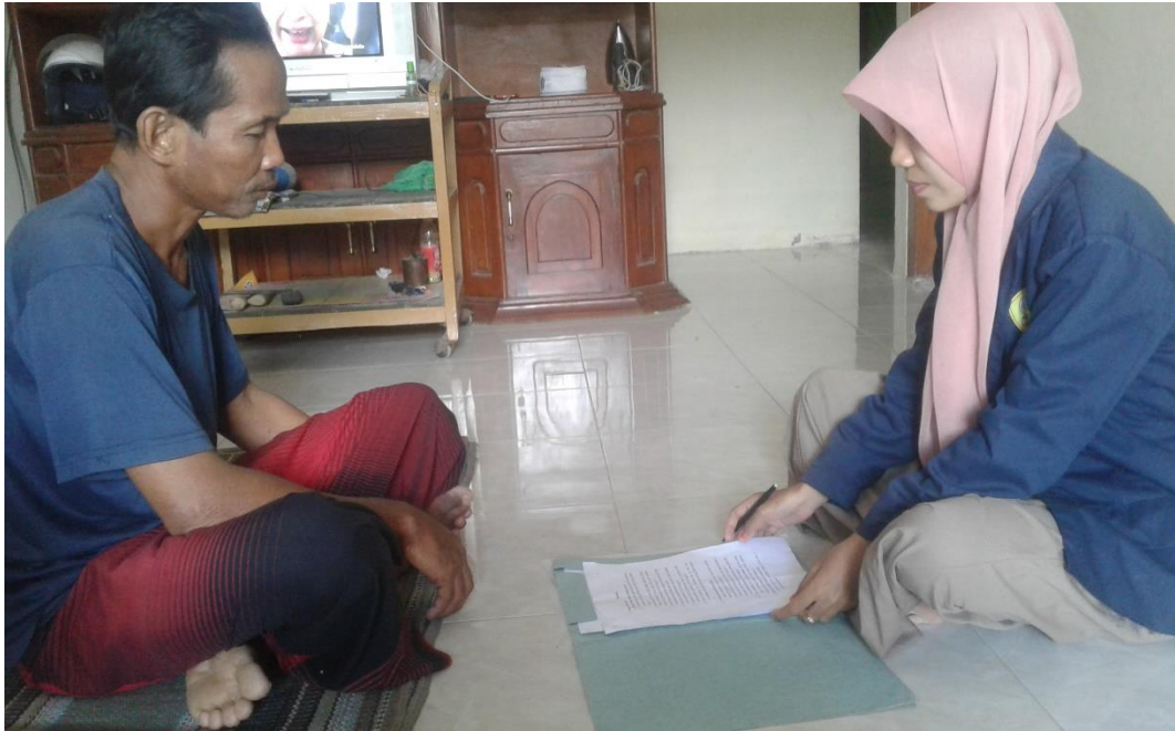
Wawancara dengan salah satu orang tua peserta didik