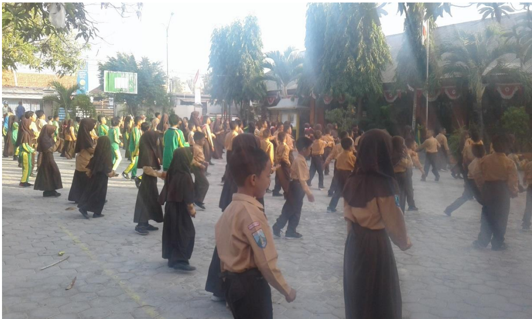
Foto saat kegiatan senam bersama pada hari jum'at merupakan bentuk penerapan peningkatan karakter peserta didik di SDN Panglegur 2