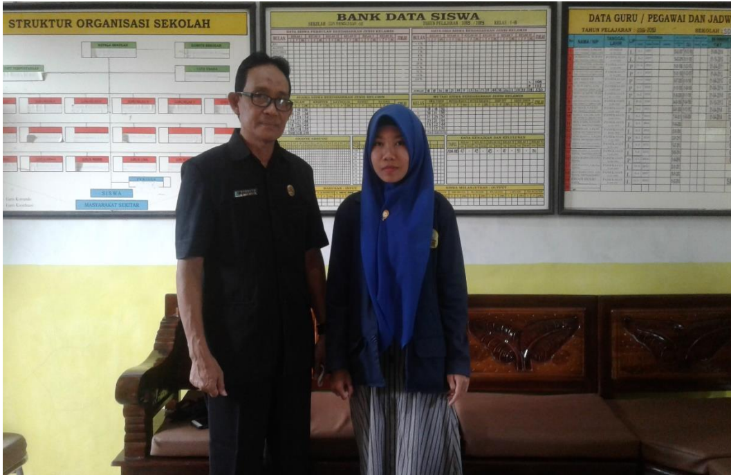
Foto bersama Kepala Sekolah SDN Panglegur 2