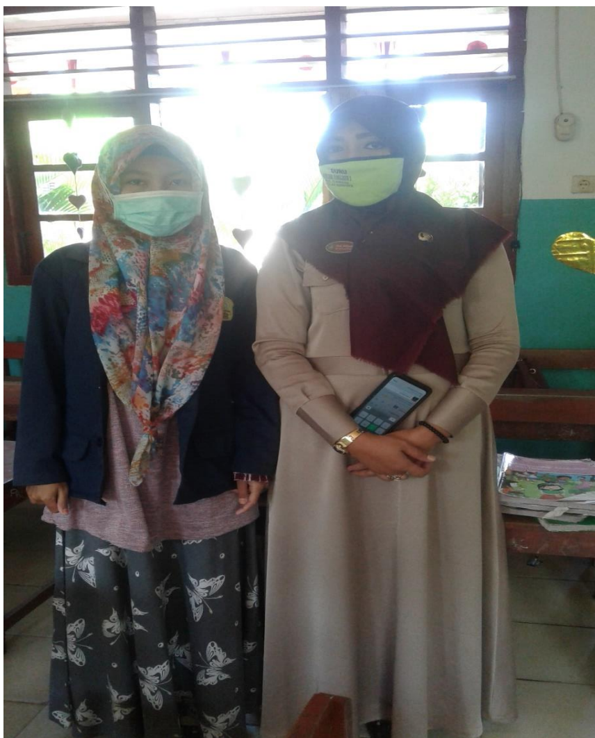
Foto dengan guru kelas III SDN Panglegur 2