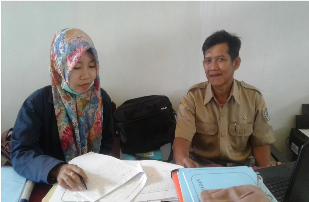
Wawancara dengan guru kelas II SDN Panglegur 2