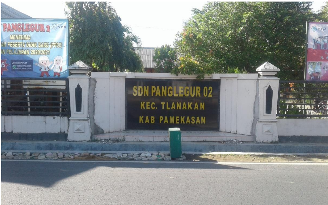
Gedung Sekolah SDN Panglegur 2