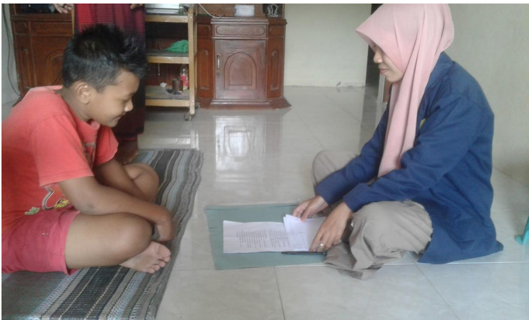
Wawancara dengan salah satu peserta didik