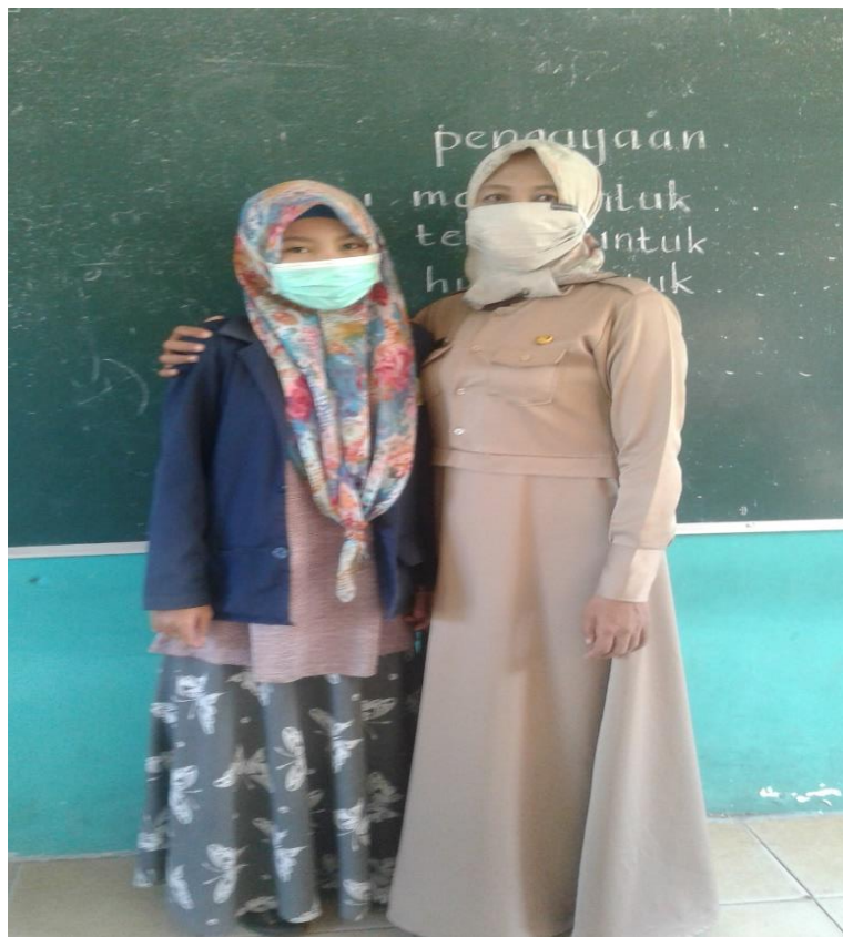
Foto dengan guru kelas I SDN Panglegur 2