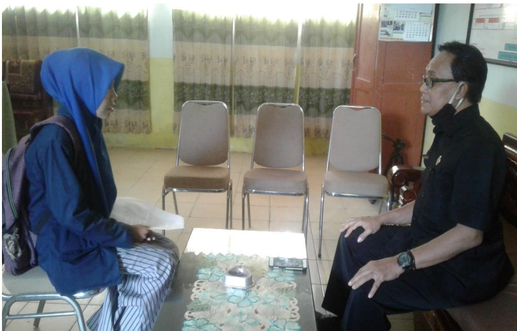
Wawancara dengan Kepala Sekolah SDN Panglegur 2