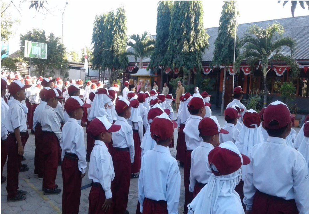
Foto saat pelaksanaan upacara bendera pada hari senin merupakan bentuk penerapan peningkatan karakter peserta didik di SDN Panglegur 2