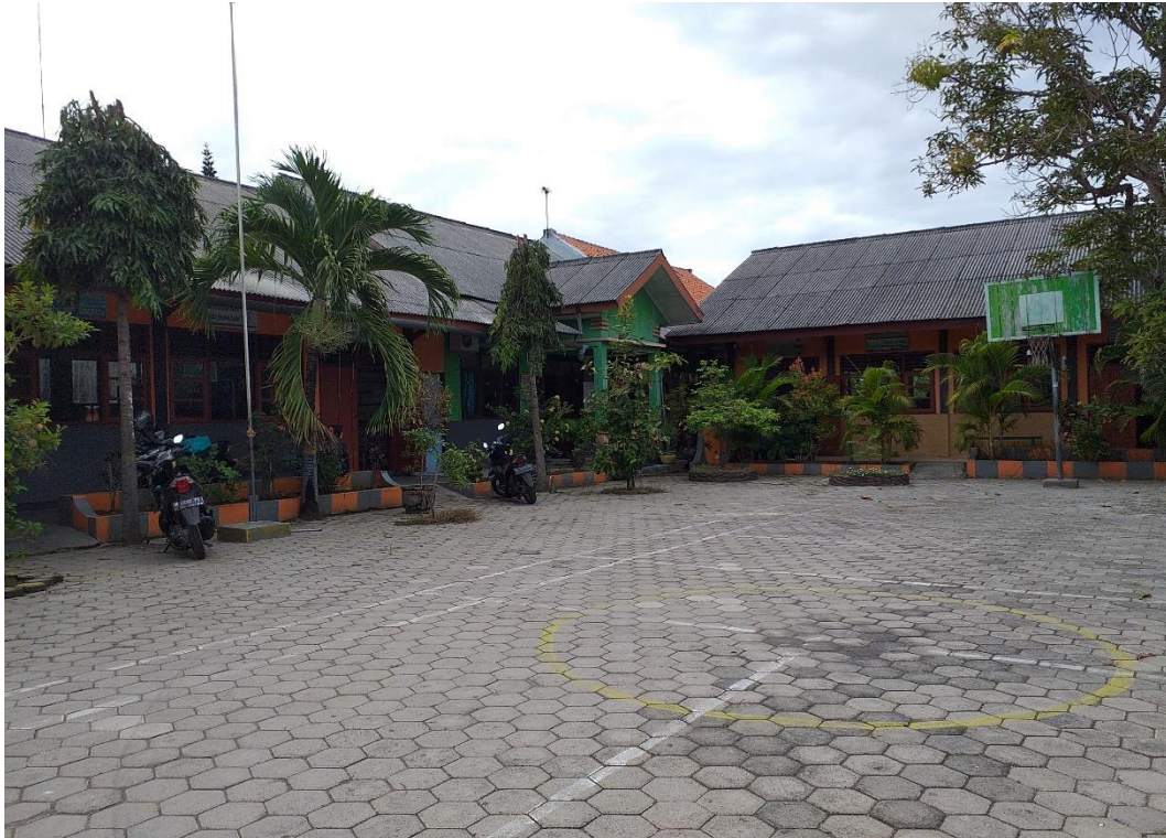
Halaman Sekolah SDN Panglegur 2