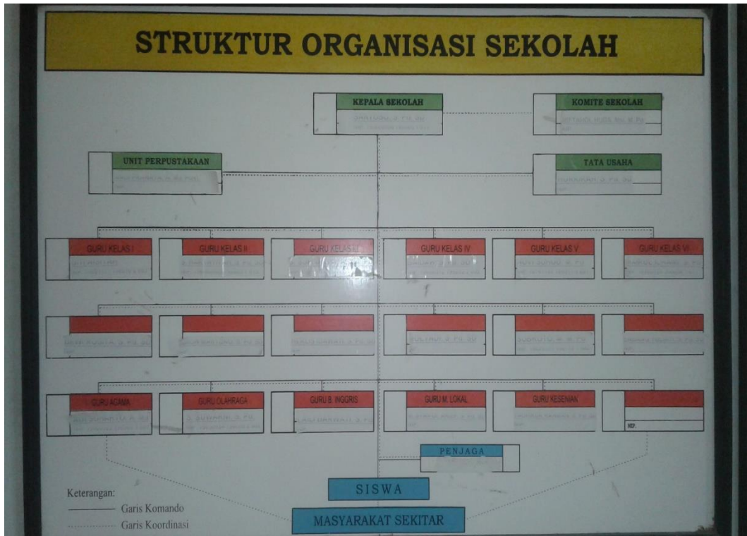
Struktur organisasi Sekolah SDN Panglegur 2