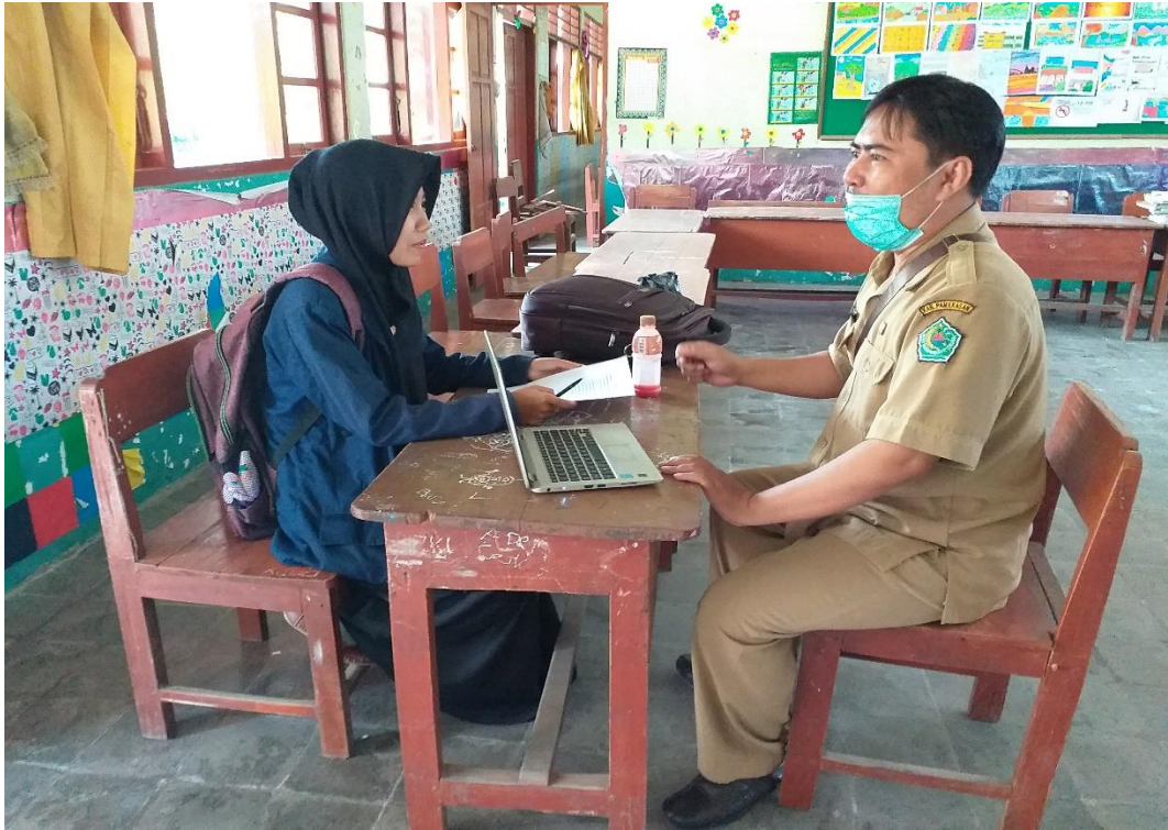
Wawancara dengan guru kelas VI SDN Panglegur 2