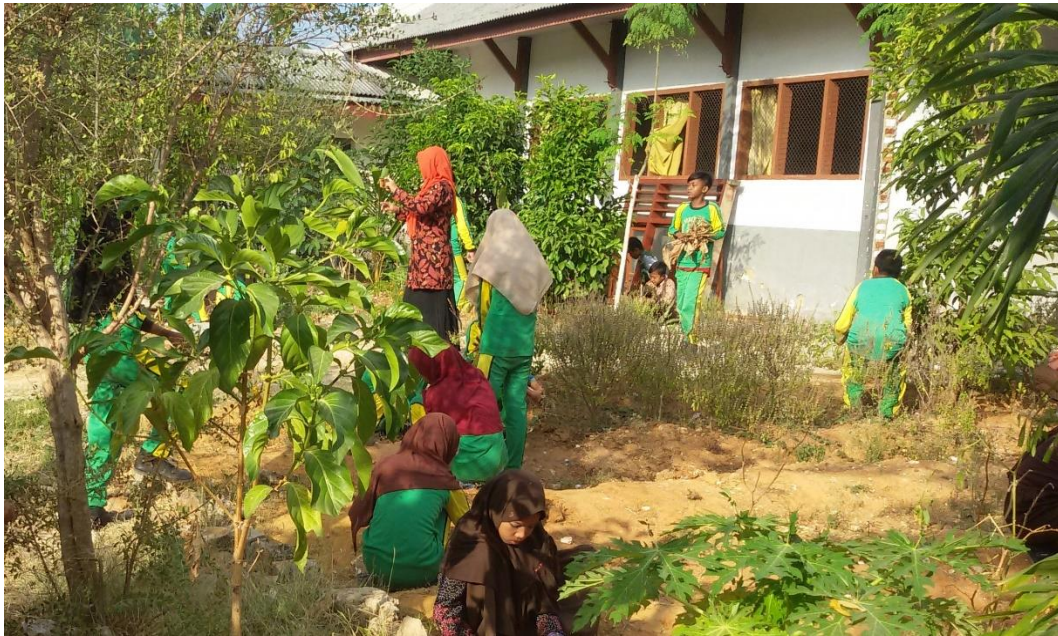
Foto saat peserta didik kerja bakti membersihkan lingkungan sekolah SDN Panglegur 2