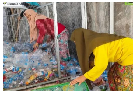
Observasi di area Bank Botol