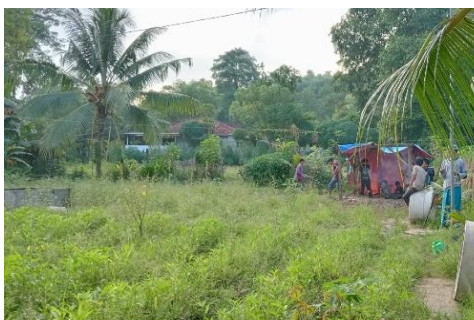
Observasi kondisi lahan pesantren