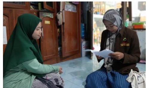
Wawancara dengan santri