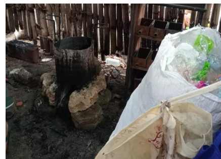
Observasi di UPT Jatian