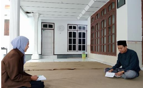
Wawancara dengan Pengasuh