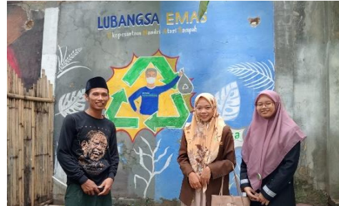
Wawancara dengan Pengurus UPT