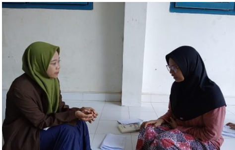
Wawancara dengan Waka 3