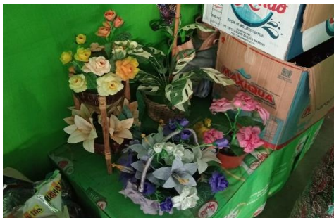
Observasi di ruang ekologi