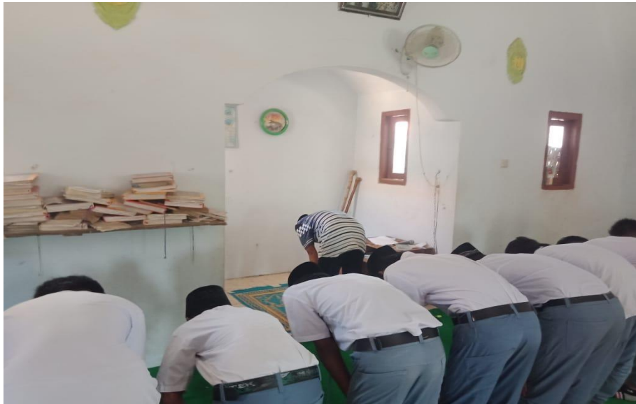
Observasi kegiatan shalat dhuha siswa SMK Al- Gaffar Kec. Palengaan Kab. Pamekasan

meningkatkan penanaman nilai-nilai religius, Jadi siswa dapat melaksanakan solat dhuha tanpa disuruh – suruh oleh gurunya sehingga dapat dikatakan mereka memiliki nilai-nilai religius dalam melaksanakan solat dhuha, Hal tersebut juga bisa dibuktikan dengan foto dokumentasi peserta mengikuti kegiatan ekstrakurikuler al-banjari di SMK al-gaffar Kec. Palengaan Kab. Pamekasan, seperti berikut: