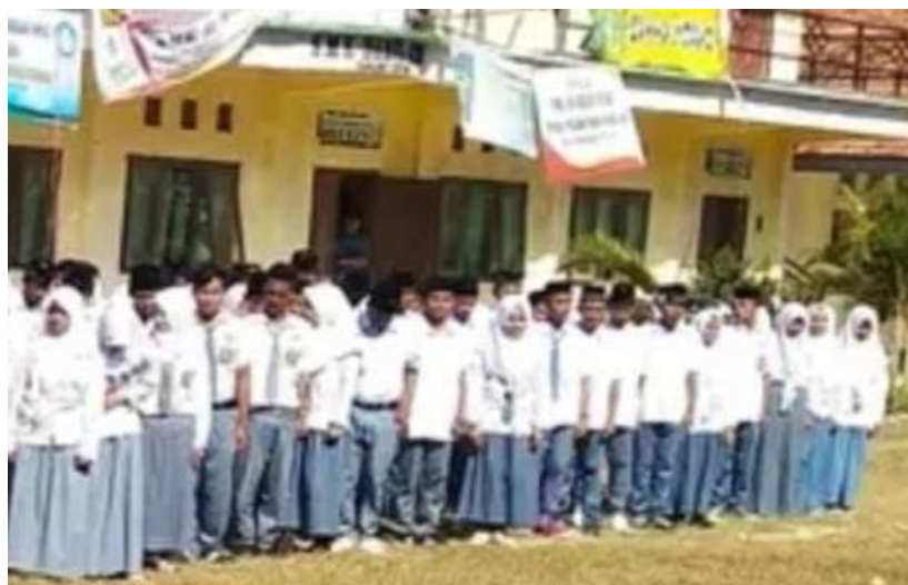
Observasi langsung pembiasaan apel pagi SMK Darul Aitam Kec. Karangpenang Kab. Sampang

kemajuan sekolah. disekolah yang tertib akan selalu menciptakan proses pembelajaran yang baik, kedisiplinan siswa untuk selalu mengikuti tiap-tiap peraturan yang berlaku disekolah. hasil observasi tersebut di perkuat dengan dokumentasi sebagai berikut: