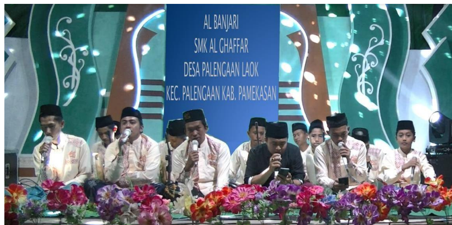
Observasi kegiatan Al banjari SMK Al- Gaffar Kec. Palengaan Kab.Pamekasan

Hal tersebut juga bisa dibuktikan dengan foto dokumentasi peserta mengikuti kegiatan ekstrakurikuler al-banjari di SMK al-gaffar Kec. Palengaan Kab. Pamekasan, seperti berikut: